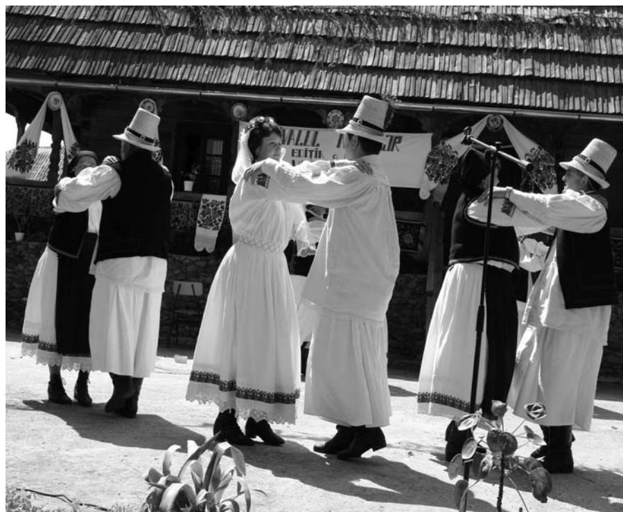
Festivalul Nunților, 2006

Asta o fo până pân anii 50, poate până pân șaizăci. Apoi luptii s-o tras încet cătră păduri mai mari, o vinit ifetele și o tăiat pădurea. Amu numai porcii mistreți mai vin la mălai, toamna după ce dă în lapte. Trebe să ai mare grijă, să nu-ți intre noaptea-n holdă.