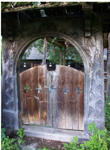
fig. 2 Portița de la intrarea în cimitirul Breb