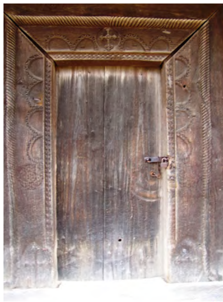
fig. 3 Portalul bisericii Sârbi-Josani

După Pamfil Bilțiu 11 , motivul ar fi „Soarele rupt”, semnificând sfârșitul lumii, atunci când vor avea loc o serie de catastrofe naturale, inclusiv dispariția planetelor, a Soarelui și a Lunii, de aici izvorând motivația pentru care Soarele este reprezentat fragmentar. Alexandru Baboș apreciază că misteriosul simbol, definit de el ca un „arc rampant”, ar aminti de norii de ploaie 12 .