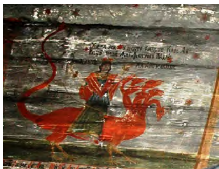
fig. 5 Balaur din pictura murală a bisericii vechi de lemn din Șieu

(fig. 5), cel cu două capete din Budești-Josani, ori Leviathanul care-i înghite pe păcătoși în