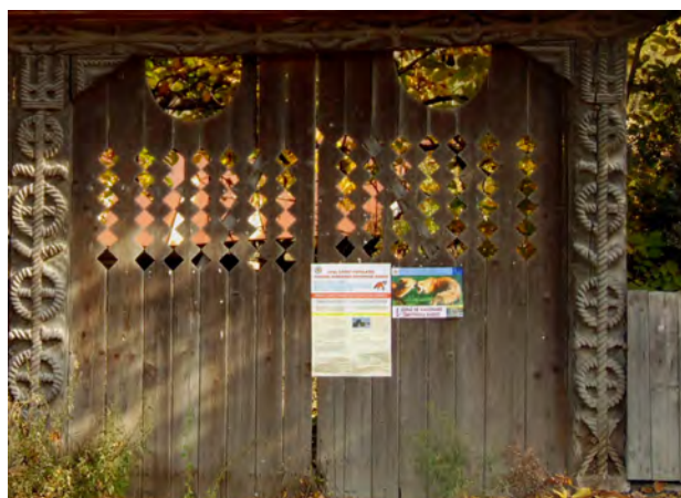
fig. 11 Poartă de pe str. Lazul Baciului, Sighetu Marmăției

Înainte de a încerca să interpretăm semnificația acestui ornament, abordăm în câteva fraze istoria începuturilor, mitologia apariției maramureșenilor pe aceste meleaguri.