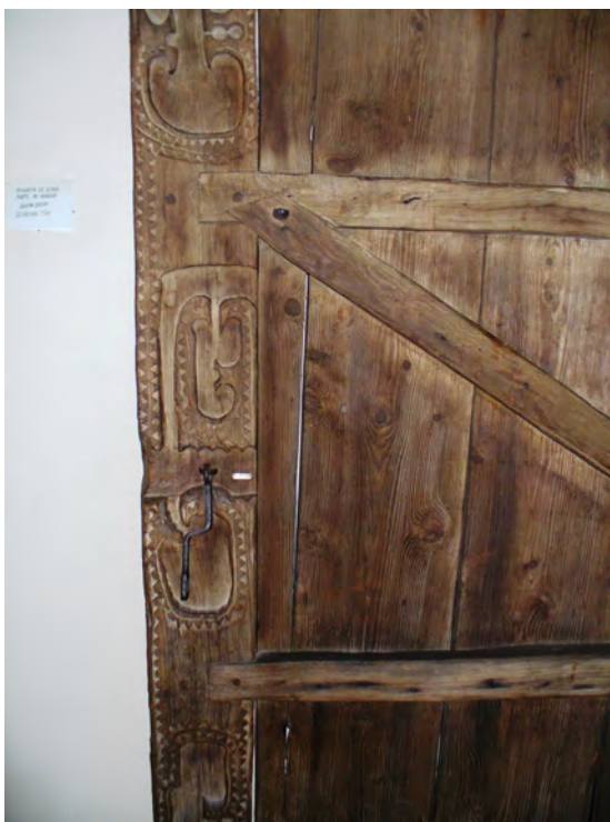
fig. 6 Poartă de șură de la Muzeul Etnografic din Sighet

Totuși, credem că un număr de uși, de șuri și grajduri din colecțiile Muzeului Maramureșului din Sighet par să reprezinte acest animal mitic; iată o imagine (fig. 6) din această