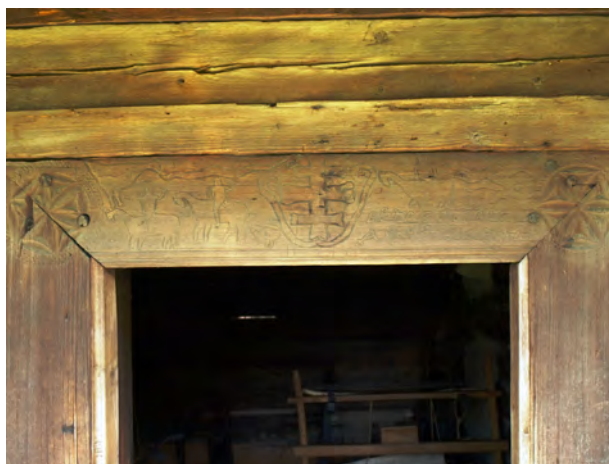
fig. 7 Portalul Casei Buftea de la Muzeul Satului din Sighet

Pe tocul ușii sunt reprezentați, de la stânga spre dreapta: doi călăreți cu săbiile scoase din teacă deasupra capului și purtând coroane pe cap; deasupra lor se află o pasăre gigantică, de mărimea unui cavaler cu tot cu cal, care pare să lupte cu un șarpe prelung; în urma celui de-al doilea călăreț mai vedem o pasăre, nu foarte mare, care pare să mănânce un alt șarpe (?); în centru se află o cruce multiplicată înconjurată de o volută care aduce cu coarnele de consacrație; la dreapta se vede un al treilea călăreț încoronat, care, cu o sabie sau buzdugan (?) luptă înspre îndărăt cu un șarpe (ori balaur) cu două capete, în scenă apărând și o pasăre; tot acolo se află și inscripția care ne spune, în litere chirilice numele proprietarului și data finalizării casei: „Bufte Vasilie 1799 luna august 6”. Grupul de elemente incizate pe portal este mărginit pe ambele părți de câte o rozetă solară.