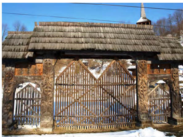
fig. 10 Poarta de intare în curtea bisericii din Cornești