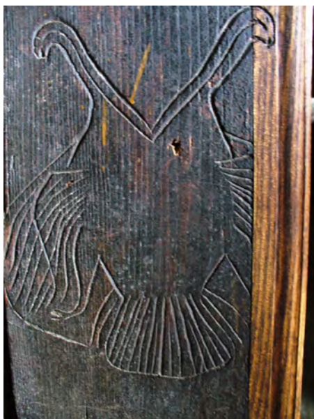
fig. 8 Casa Buftea de la Muzeul Satului din Sighet, portalul interior

Tot în aceeași casă, pe portalul interior apar acvila bicefală (simbol heraldic al Casei de Austria, ceea ce l-a determinat pe Al. Baboș să emită supoziția cu împărații austrieci), o pereche de animale cornute (probabil cerbi) dar și o pereche de păsări afrontate, care pot reprezenta fie perechea cocoș – găină, adică bărbatul și femeia casei, fie, din nou, un cuplu de totoine, mascul – recunoscut prin creasta sa, respectiv femelă ( fig. 8 și 9 ).