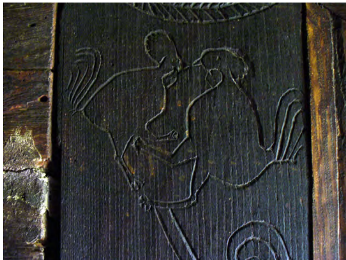
fig. 9 Casa Buftea de la Muzeul din Sighet, fragment de portal interior

Pare greu de crezut, dar nu imposibil, ca o mândră, renumită și străveche familie de luptători nobili maramureșani, Buftea, să fi acceptat să-și împodobească ambele portaluri ale casei cu acvile imperiale alături de găini, în afara cazului în care orăntania ar fi fost semnul său heraldic, lucru care ne rămâne necunoscut, deocamdată. Sigur, Buftea Vasile a știut foarte bine ce vrea să transmită misteriosul său desen, probabil vreo legendă ori poveste istorică cu totoine care nu ne-a parvenit, nouă nerămânându-ne decât presupunerile.