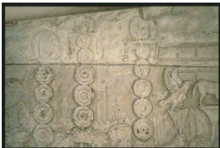
fig. 12 Signifer-ul legiunii I Minerva, scena 48 de pe Columna lui Traian.