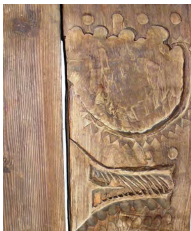
fig. 4 Poartă de şură de la Muzeul Etnografic din Sighet

Pe uşa unei şuri aflată în expoziţia etnografică de bază a Muzeului Maramureşului din Sighet, am identificat un semn rar, pe care l-am interpretat ca fiind amprenta palmară a labei ursului, imaginea fiind suficient de sugestivă încât să nu mai necesite alte explicaţii ( fig. 4 ).