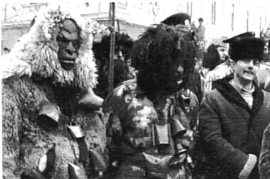
“Draci” din “Viflaiemul” din Slatina, la Festivalul Datinilor de Iarnă, Sighetul Marmăției, 2002

Cu noi nu vorbi așa, Măcar ești în casa ta, Ci vorbește voarbe bune Nu niște prostii și glume!