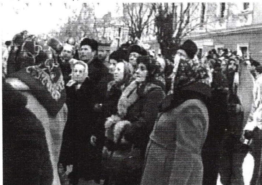
Colindători din Slatina, Festivalul Datiniilor de iarnă, Sighetul Marmăției, 2002

Înaintea iestor curți Sunt tri rânduri de pomuț, Înaintea pomnilor Șăde doamna curților Cu turma oițelor, C-un pahar de zin în mână, Tăt înt'ină și sust'ină. Pa toarta paharului Scrisă-i raza soarelui, De unde ține cu mâna