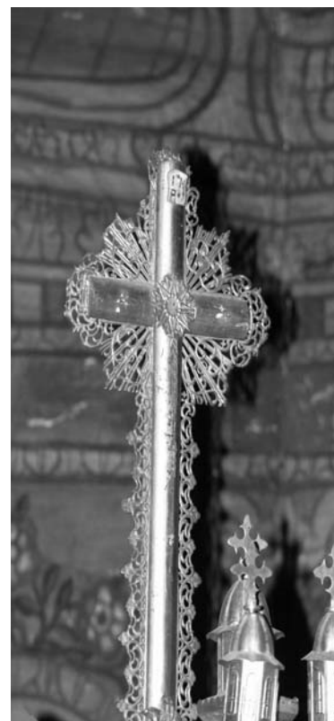
Mândrelor din mâini făcând.

N-o știut baba că ce să facă cu fata, să-i ieie fecioru, să i-l puie la fata iei, să ie pă fata iei. Fecioru n-o vrut nicicum, o lua pă fata babii, pă fata moșului. Și s-o dus la tată-so cu ie acasă, la tată-so tare bine i-o