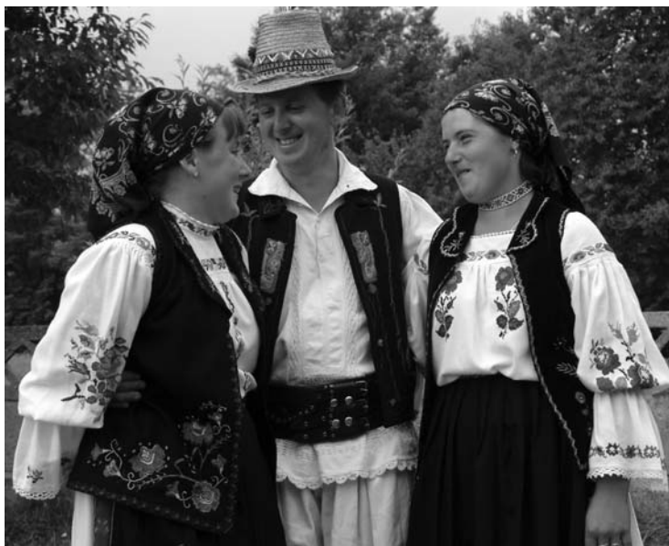
Nuntași din Preluca Veche, 2006

Oh, my luck, I had you all Since mom carried me along