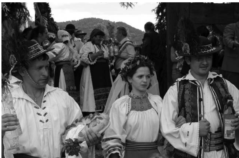
Festivalul nunților, 2006

Starostele rostește rugăciunea „Tatăl nostru“. Abia apoi se poate începe servirea bucatelor. Paharnicii (bărbați care sunt rudenii cu mirii), câte unul la o masă, împart țuica. Cu un singur pahar se da, pe rând, la nuntași, cam câte două pahare la fiecare. Mai departe se serveau din țuica pe care