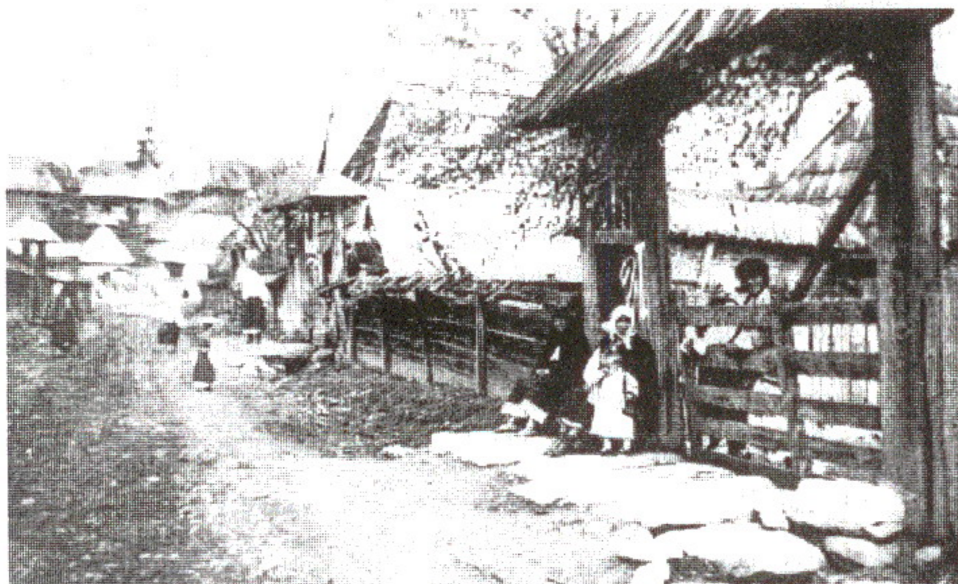
Francisc Nistor: Uliță din Bârsana, 1936