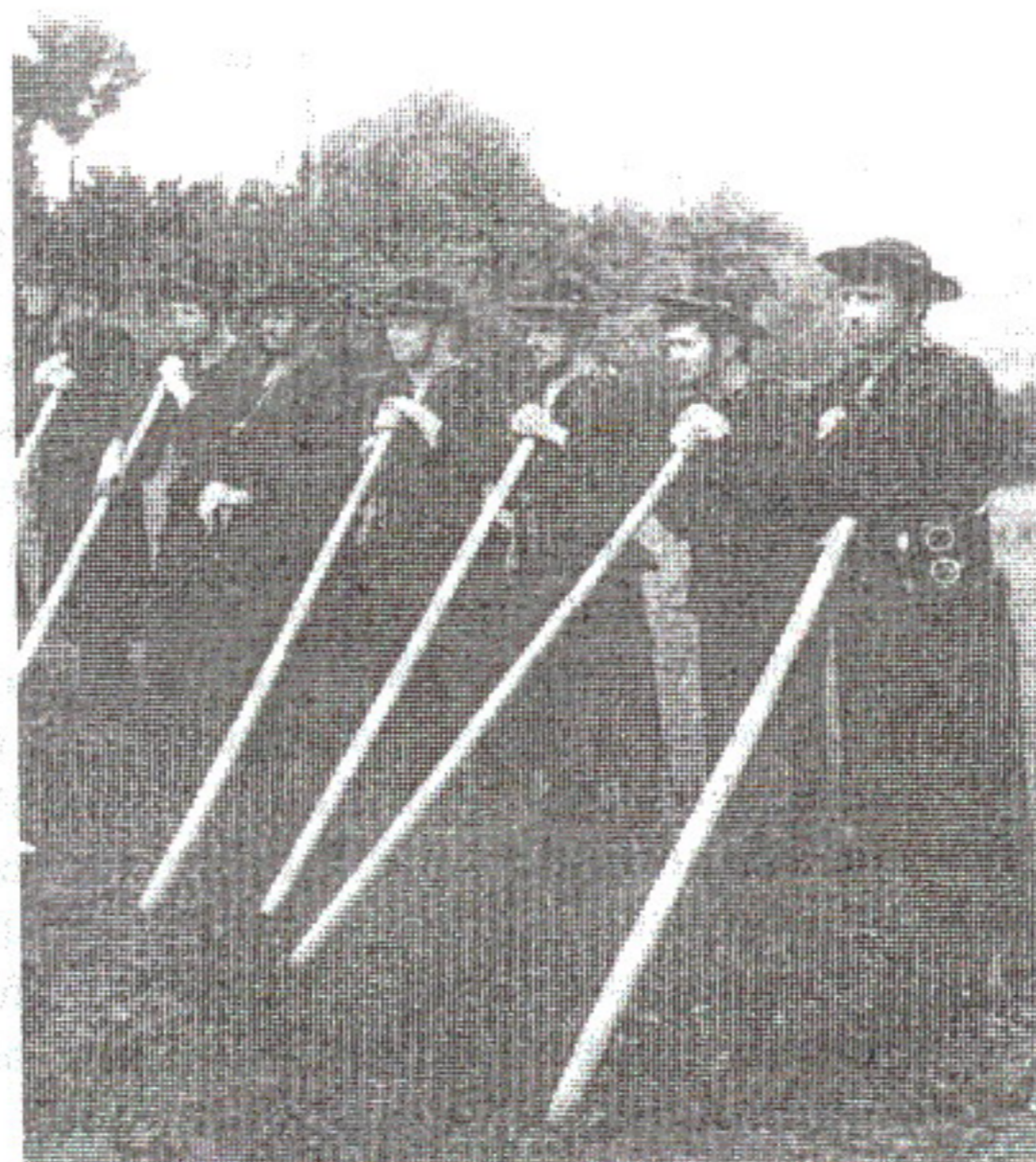
D. Iuga: Păcurari din Berbești, 2000

Ajung la ceteraș acasă, se cântă un pic acolo, își formează oleacă strigăturile că după șapte săptămâni de post în care nu se cântă este nevoie de un pic de practică, nu-i ca acuma, ținea cont de post lumea și nu se cânta până a doua zi de Paști. De aceea feciorii și fetele abia așteptau să vină Paștile, să se poată veseli din nou. Feciorii îi luau pe ceterași și coborau cu ei horind și strigând, să audă fetele și babele că începe jocul. Cine credeți că ajungeau primii la locul unde era jocul? Copiii, care erau curioși. Ei se așezau în podul șurii, dacă jocul avea loc în șură. După ce feciorii ajungeau la locul jocului, prima dată jucau de băut și bărbătesc până veneau fetele. Aici se lua greața de către cei care intrau în joc pentru prima dată, până nu