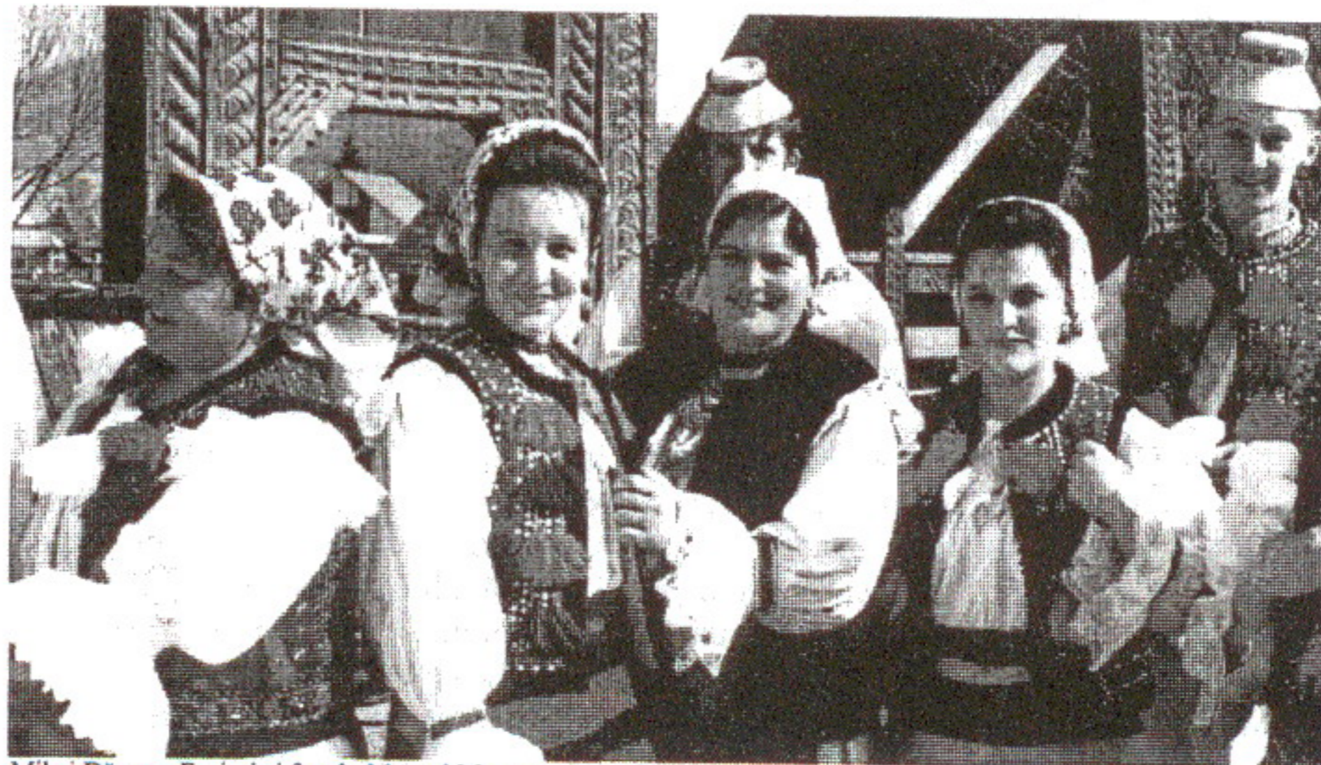
Mihai Dăncuș: Feciori și fete în Muzeul Maramureșean, Sighetul Marmăției

Dar și fata este interesată să fie sigură că dacă merge la joc o să fie chemată să joace și nu rămâne de rușine, și apoi se știe cum îs babele: "noa, ni-o-ai și pe cutare, i-o făcut cojoc și n-o joacă nimeni" și atunci îi mare rușine pe fată să rămâie nejucată a doua zi de Paști. Dacă fata nu are siguranță că va fi jucată, atunci mamele fetelor le arvonesc pe fete la feciori neamuri, să fie băgate-n joc; aici, de fapt, este lansată fata, când este băgată-n joc. De fapt chiar din joia mare seara (de litie) când toată lumea merge la biserică pentru a aprinde lumânări la morminte, feciorii se adună roată în sintirim și se organizează pntru a doua zi de Paști: cum să fie jocul și unde, se alege feciorul care va fi șeful jocului și va răspunde de ceterași și de taxa care va trebui dată de fiecare fecior la joc. Unde sunt mulți feciori în sat se făceau chiar și două jocuri și era și o mare concurență între feciori, de multe ori riscau să rămână și fără fete la unul din jocuri și să se facă de răs. De aceea feciorii se aleg între ei foarte bine și numai acei feciori care sunt neamuri împreună și sunt prieteni și care-s mai