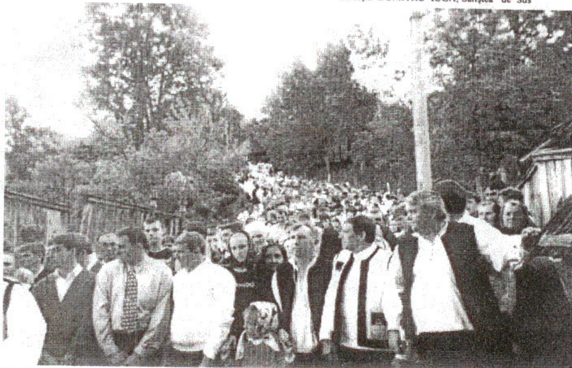
D. Iuga: De Rusalii, Budești, 2001