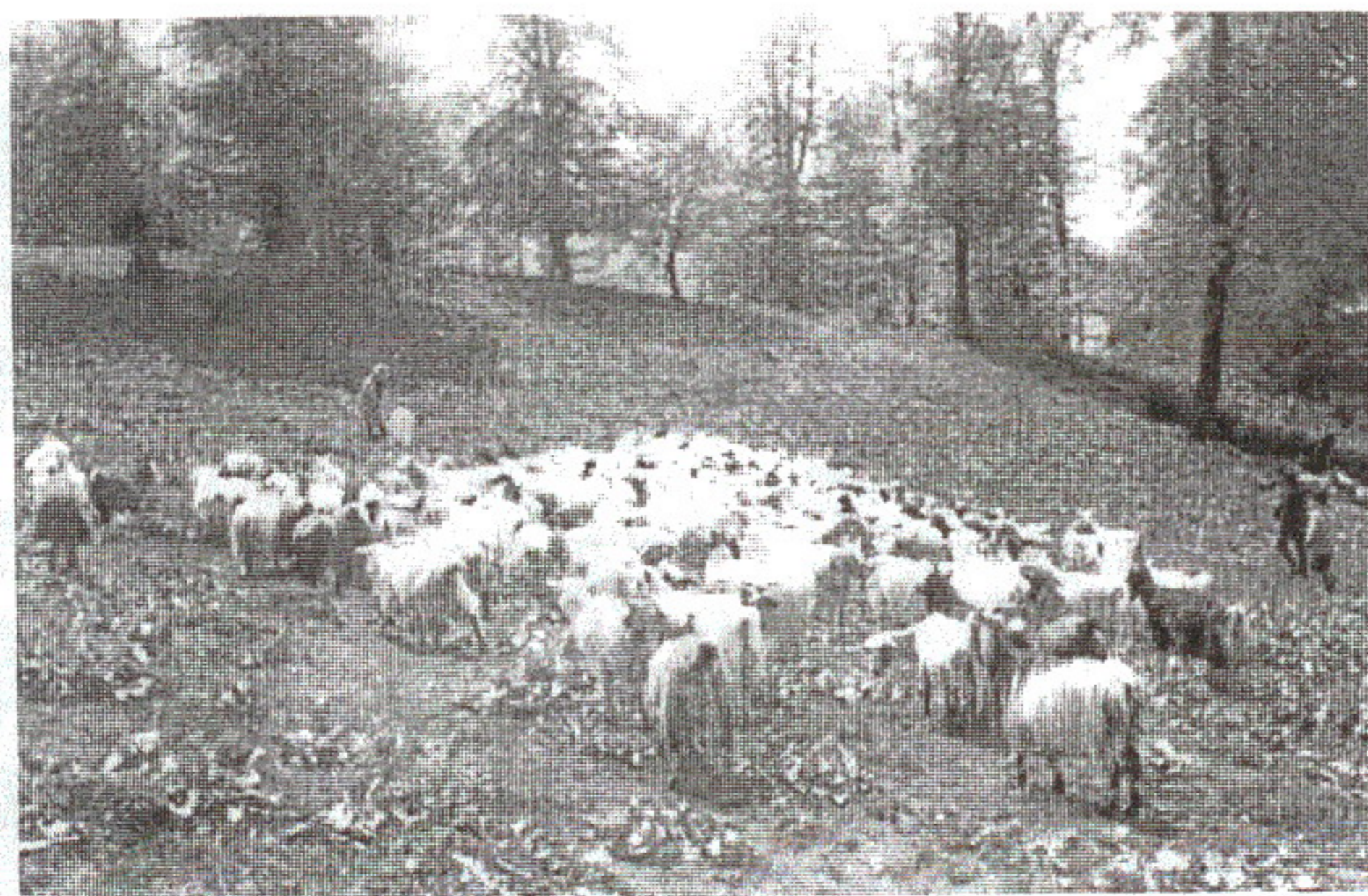
O “lăptărie” mânăată spre stână, Ieud, 2000