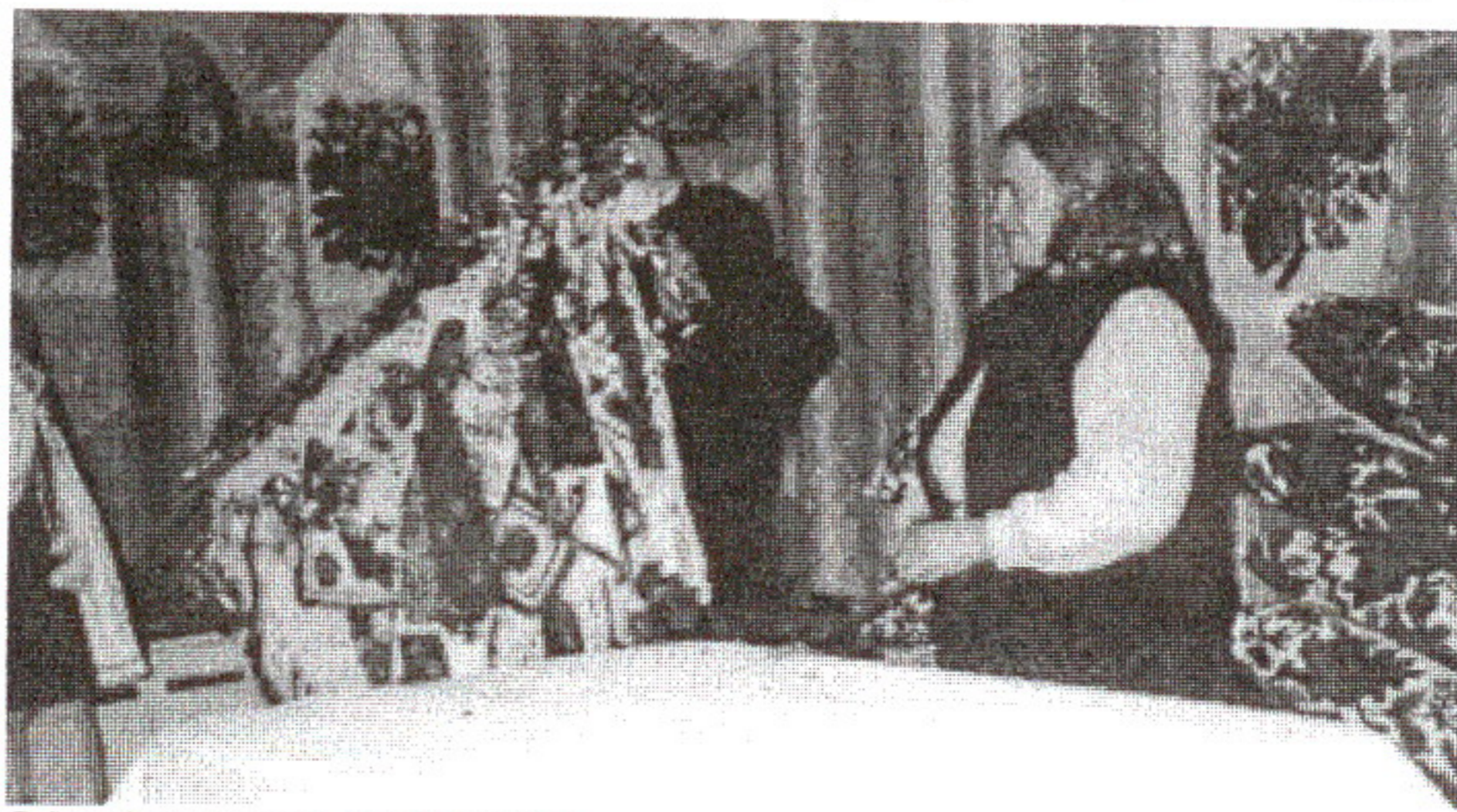
D. Iuga: Cusutul steagului, Poienile Izei, 1998

Spre casă. Până la poarta bisericii mirii merg "alătura", cu lumânări aprinse. De aici, încadrați de nași și druște, se îndreaptă spre casă și în locul unde