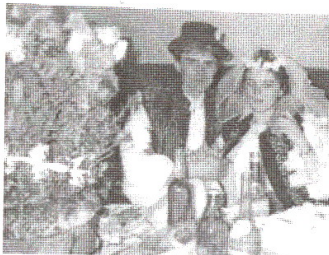
D. Iuga: Miri din Săliștea de Sus, 1995

Nu vă uitați că nu-s multe Că-s de mâna ei făcute, Că zestrea nu-i cumpărată Că-i de mnireasă lucrată, De mnireasă și mă-sa Că le-o plăcut a lucra, N-o stat cu ochii-n fereastă, Nici cu coatele pe masă - C-o stat cu ochii-n pământ Și la lucru tăt gân(d)in(d). Soacră mare, ieși afară Că ța-am adus zestre mare, Soacră mare, ieși în prag Și ne-ntâmpină cu drag.