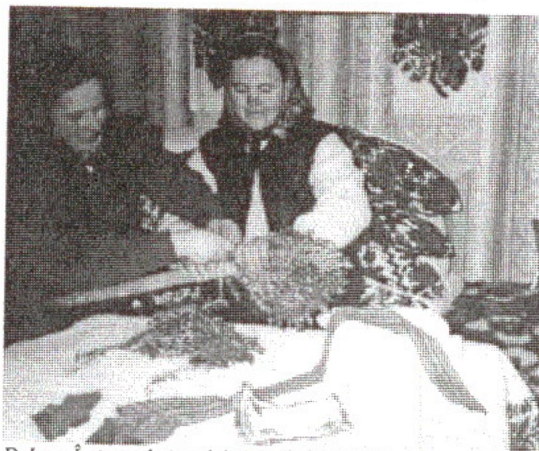
D. Iuga: Înstruțatul steagului, Poienile Izei, 1998

Tu mnireasă, draga mé, Ț-o poruncit maică-ta Să grijești de soacră-ta: Tăt cu mere și cu nuci Și s-o iei cu vorbe dulci, Tăt cu mere și cu pere,