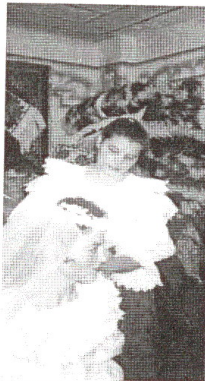
D. Iuga: Gătatul miresei, Săliștea de Sus, 1995

Mnireasă din neamu meu, Ascultă ce-oi zîce eu: Dacă-acolo ți-i întra Rându-n casă nu-l strîca