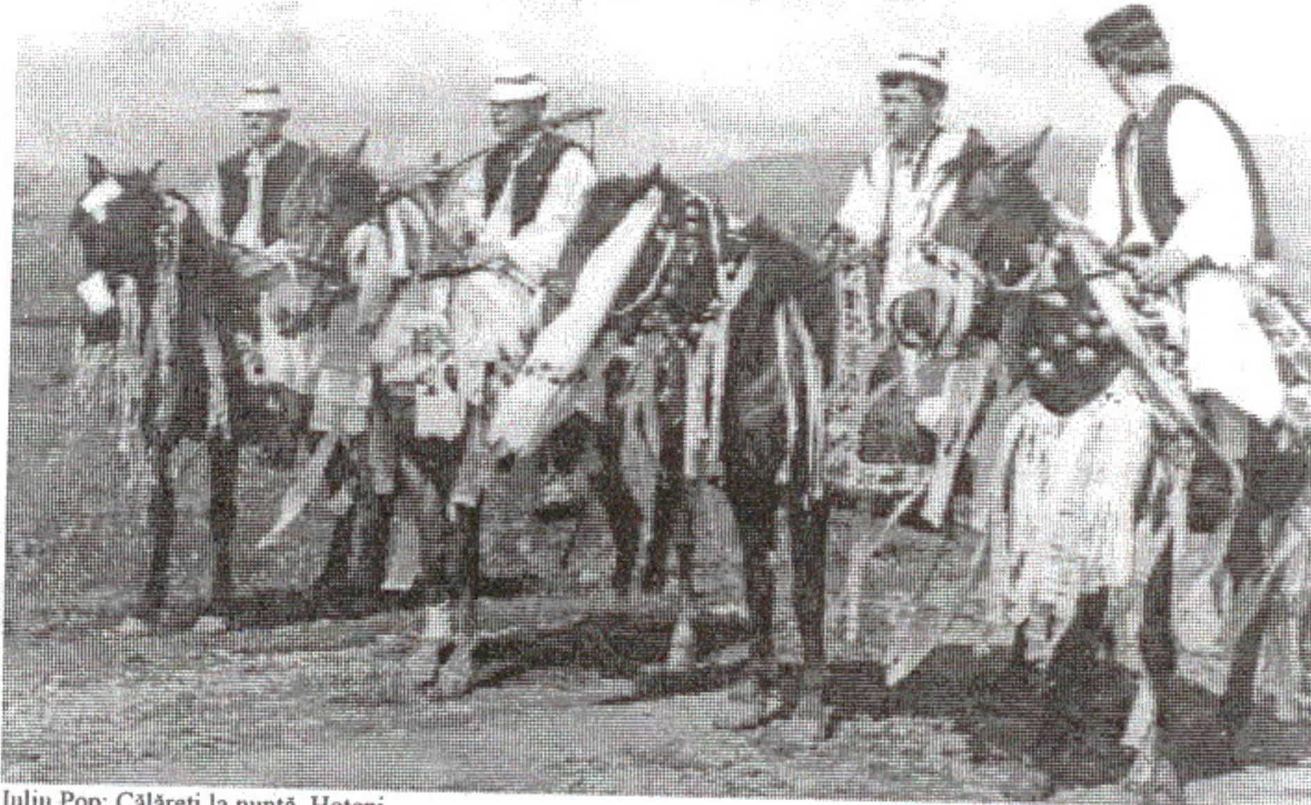
Iuliu Pop: Călăreți la nuntă, Hoteni

Fetele mai tinere (codanele) și flăcăiandrii sunt îmbrăcați mai simplu. Feciorii se încălță tot cu opinci de oargă și obiele de pănură, se îmbracă iarna cu cioareci de lână albă și cu suman negru "postăzit" (tivit cu catifea neagră), pe cap cu "cujmă" neagră. Vara poartă, peste cămașa de pânzoaică subțire, "teptari" (pieptar, cojoc) "înflorit" - cusut cu "cărmăjie" (piele prelucrată folosită pentru împodobit), cu "gatii" de pânză, cusute jos în "roituri" (broderie), cu puțin trecând peste genunchi. Pe cap poartă clop negru.