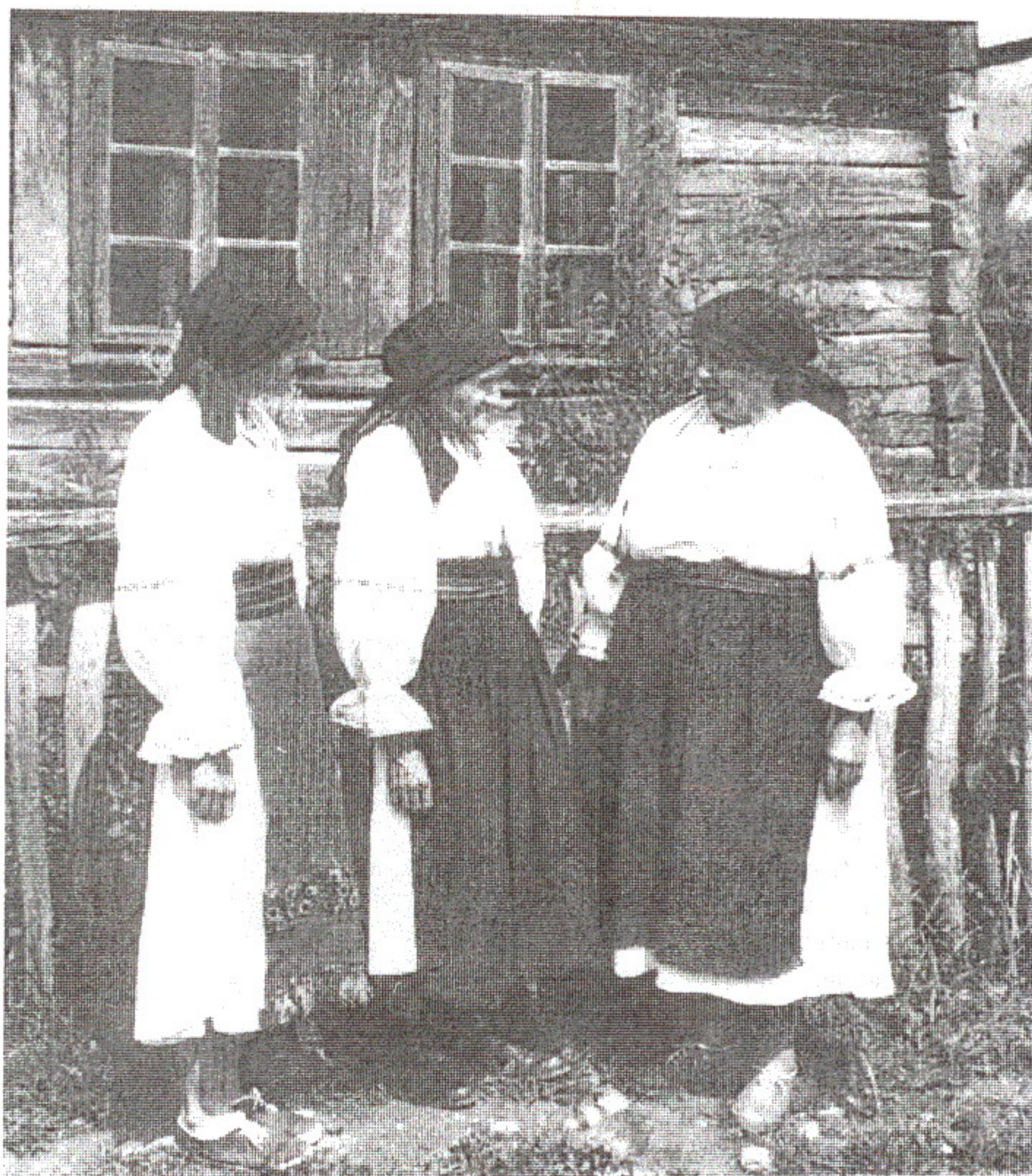
Ioan Nădișan: Femei din Suci de Jos

Strig o fată din vecini Ca s-o apăr de găini