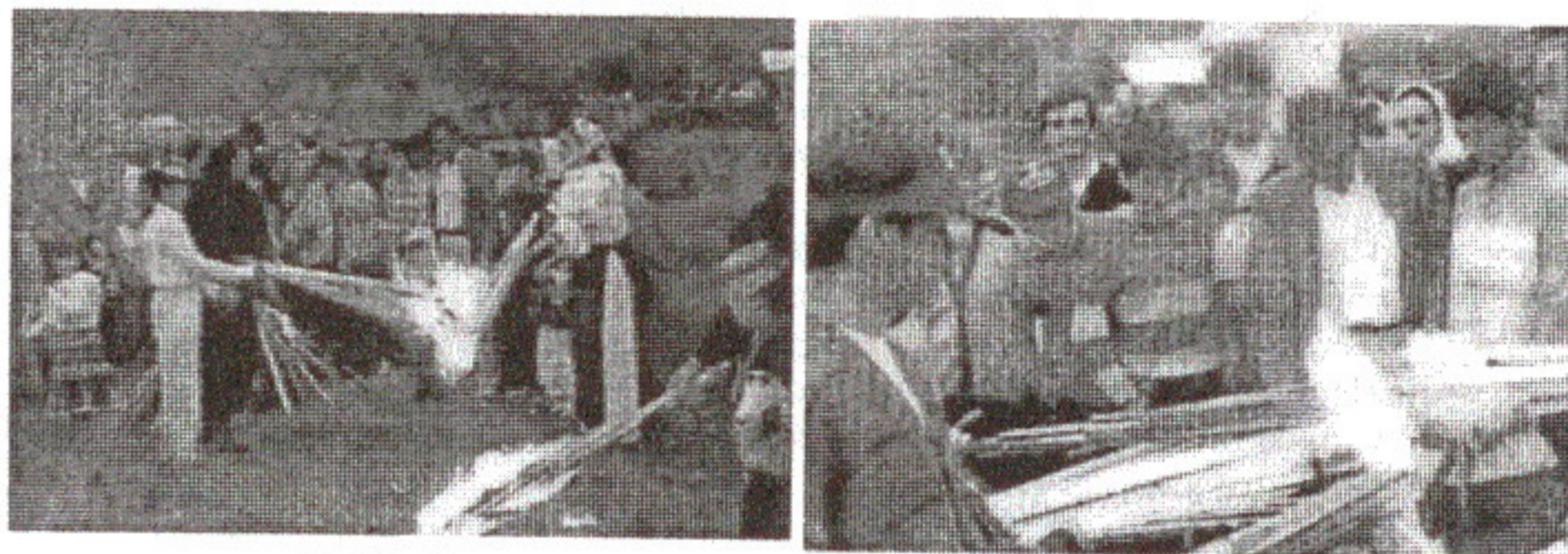
Făclii de Sânziene la Vișeu de Jos, 1999 - după filmări de IOAN MEDAN

Sărbătorile solstițiului, răspunzând unei nevoi aproape instinctuale a populației, erau atât de puternic înrădăcinate în spiritul popular, încât Biserica, luptând împotriva abuzurilor și a libertinajelor, a trebuit să admită existența acestor rituri străvechi. Și, mai degrabă decât să comită eroarea de a le aboli, a favorizat conversiunea lor. Nu e o întâmplare faptul că solstițiile sunt marcate de aceste mari figuri ale creștinătății, care sunt cei doi sfinți: Ioan, 24 iunie este ziua dedicată Sf. Ioan-Botezătorul, pe când la celălalt pol solstițial, 27 decembrie, se cinstește Sf. Ioan Evanghelistul.