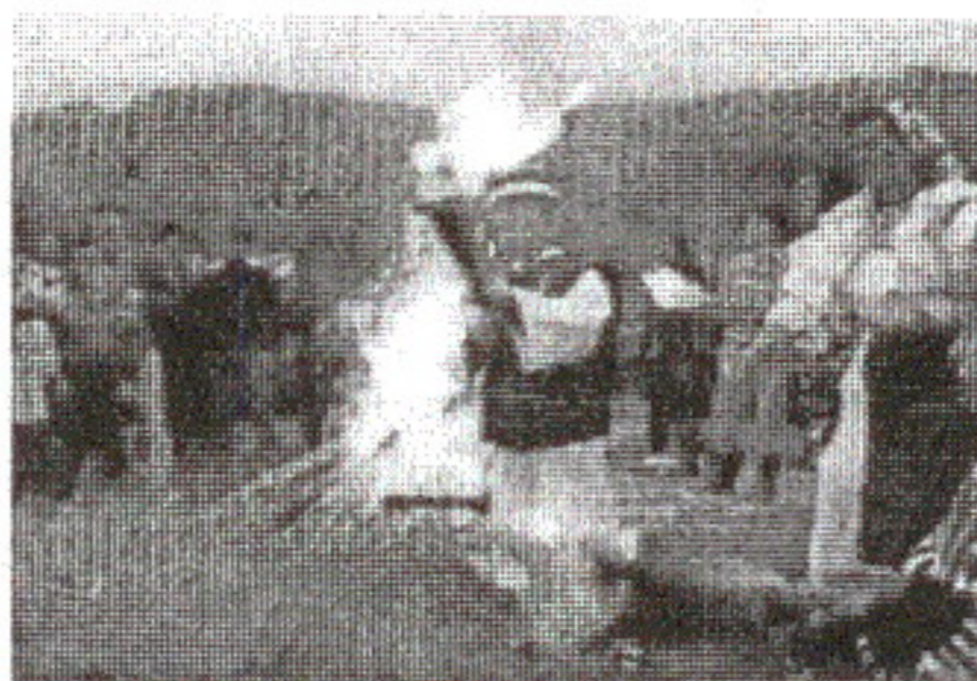
Făclii de Sânziene la Vișeu de Jos, 1999 - după filmări de IOAN MEDAN