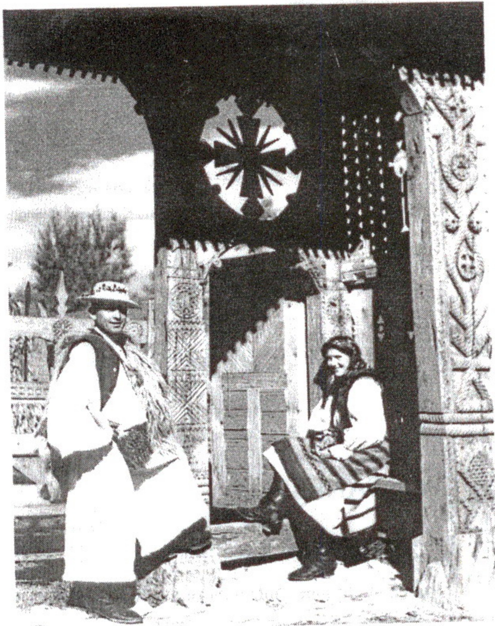
Francisc Nistor: Poartă din Mara, 1937