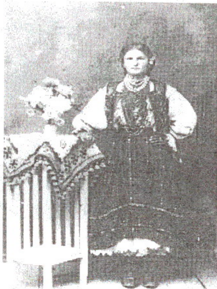
Fată din Bârsana, 1904