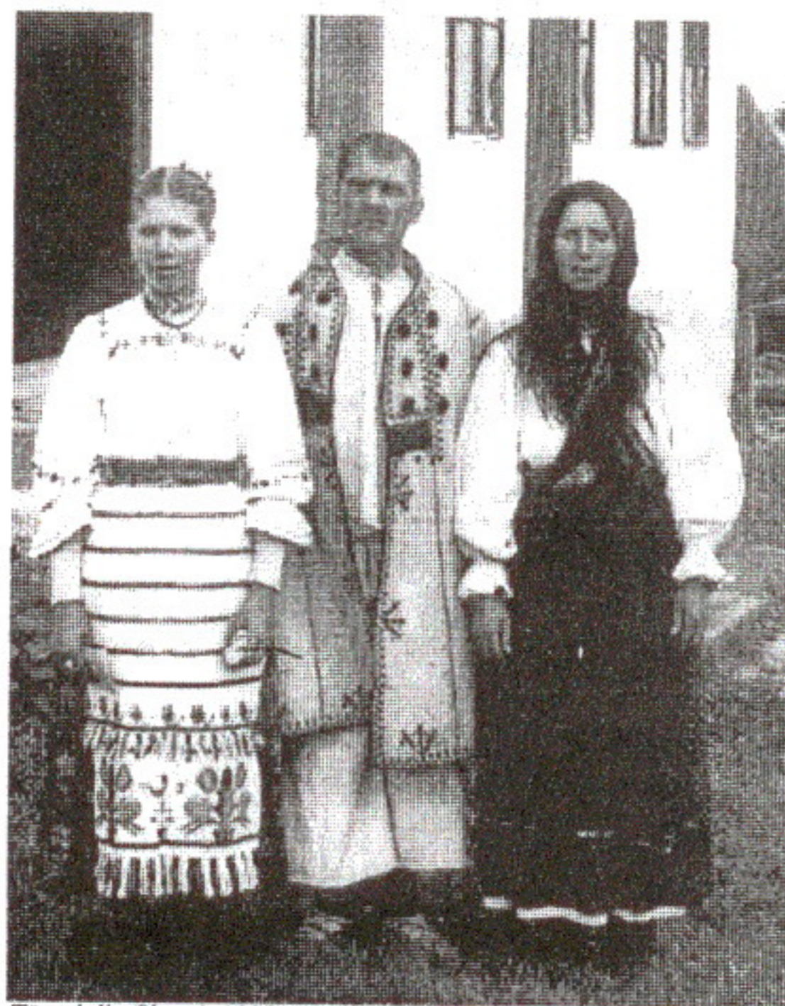
Țărani din Șeșești, 1928

O samă, când zin cu teara de la urzoi, o aruncă pe ușă și poartă ușa iute-iute, tăt pe fugă, să îmble teara fuga. Când se taie teara, tăt din casă