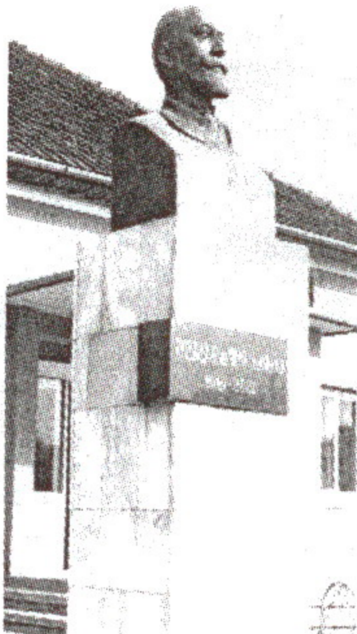
I. Nădișan: Bustul lui George Pop de Băsești la Casa Memorială, Băsești

Uiaga-i în mâna mé Ș-o-i întina cui oi vré Ș-o-i întina mândrului Că-i ca cranga tidrului, Ș-o-i întina la badea Că-i frumos ca viola.