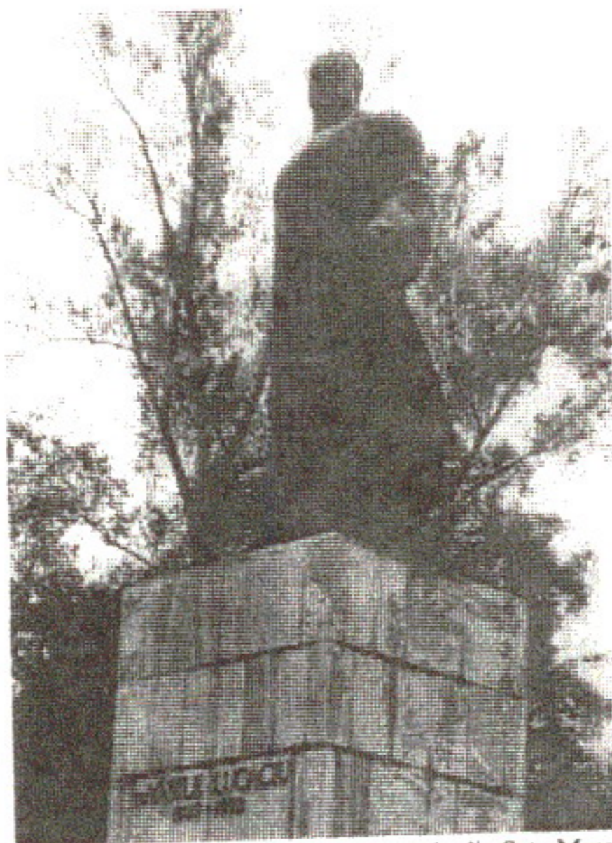
Statuia lui Vasile Lucaciu din Satu Mare. Sculptură de Ion Medrea.

A avut parte de funeralii naționale desfășurate la Satu Mare și la Șişești, în ziua de 1 decembrie 1922, cu participarea unor distinse personalități politice ale vremii, dar mai ales a mulțimii de români doritori să aducă un ultim omagiu celui care ocupă un loc de frunte în Generația Unirii.