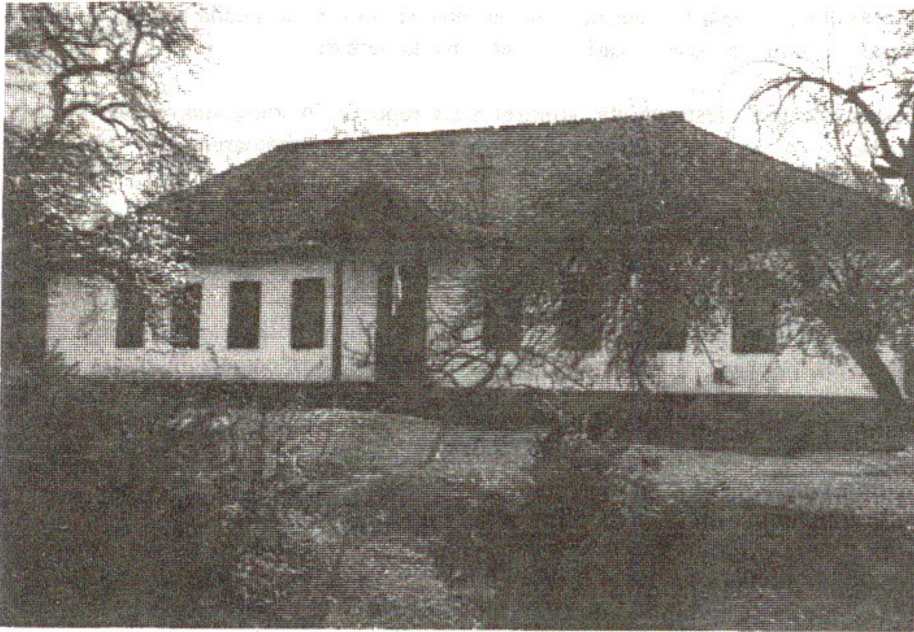
Lucia Pop: Școala înființată de Vasile Lucaciu în 1905, Șișești, 2000

cultul divin s'au procedat la sfințirea bisericii, după învitarea și programul următor: