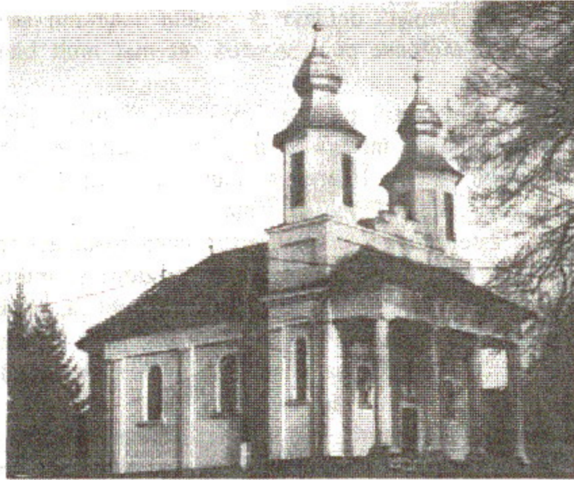
Foto: Felician Fărcaș: Biserica din Unguraș, ctitorie a lui V. Lucaciu