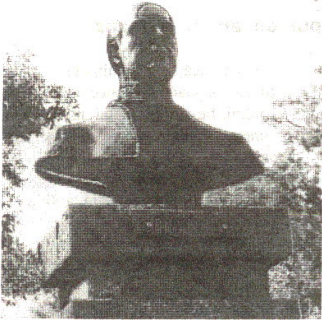
Statuia lui Vasile Lucaciu, Șișești

de prietenie cu Dr. Lucaciu, n'a pregetat a veni să fie de față la serbările din Șișești.