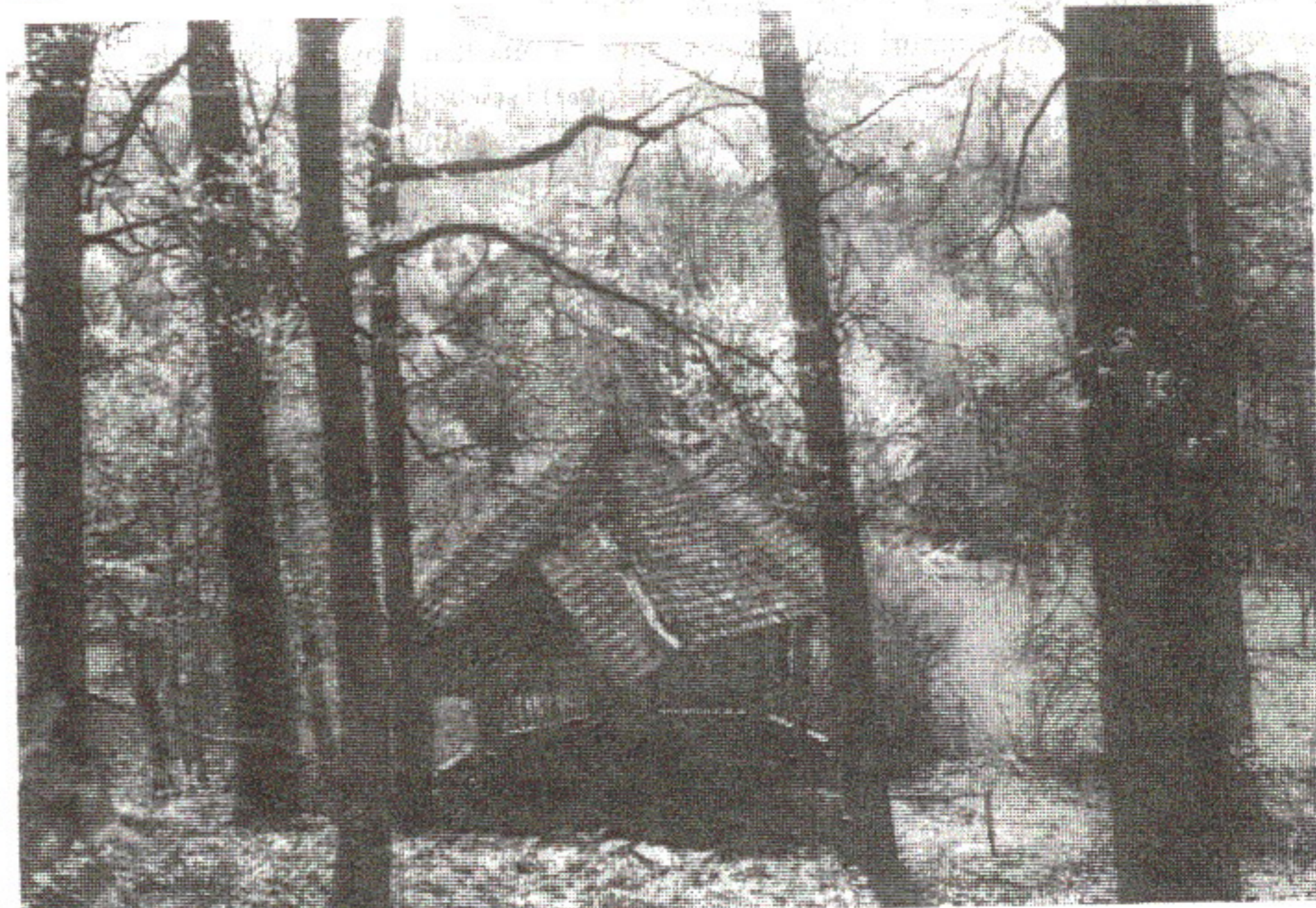
Lucia Pop: Izvorul lui Traian (Izvorul Romanilor), Șişești 2000

Terminându-se lucrările zidirei într'atâta, cât să se poată celebra în biserică