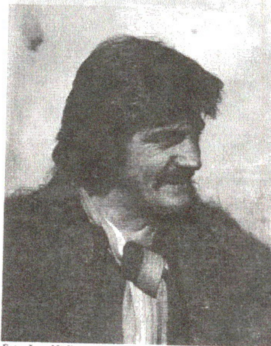
Florin Piersic în rolul lui Pintea