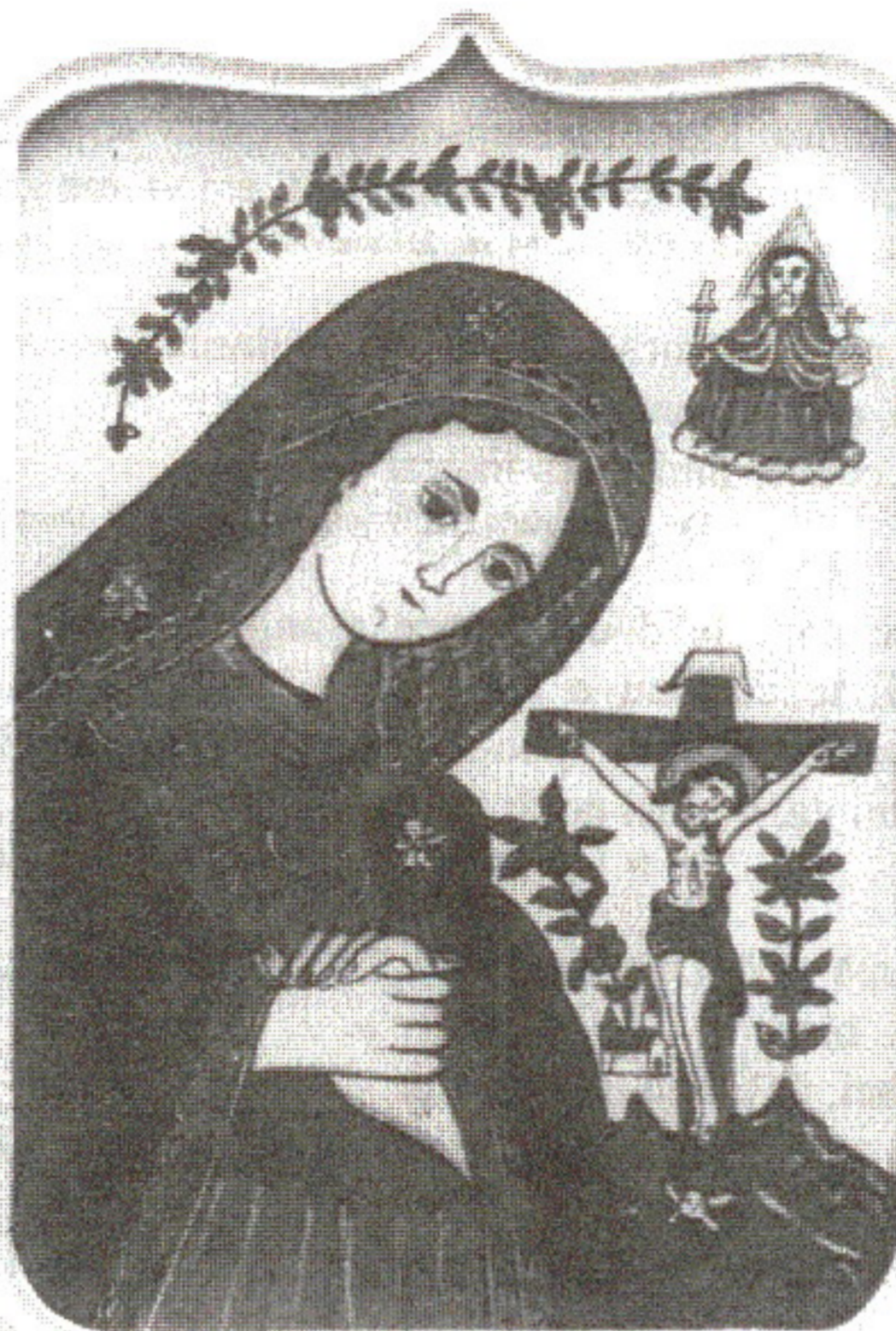
Maica Îndurerată. Icoană pe sticlă de Georgeta Maria Iuga

Sfântă Mărie, Maica Sfântă, Așa să n-aibă putere