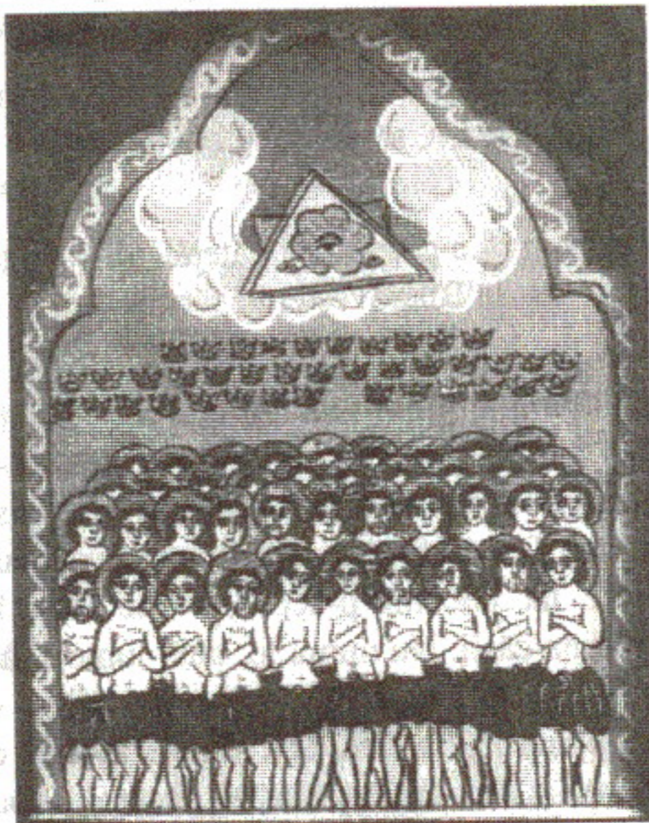
Cei 40 de Mucenici. Icoană pe sticlă de Georgeta Maria Iuga

De la Gheorghe Podină, 61 ani, 1995, Băița de sub Codru