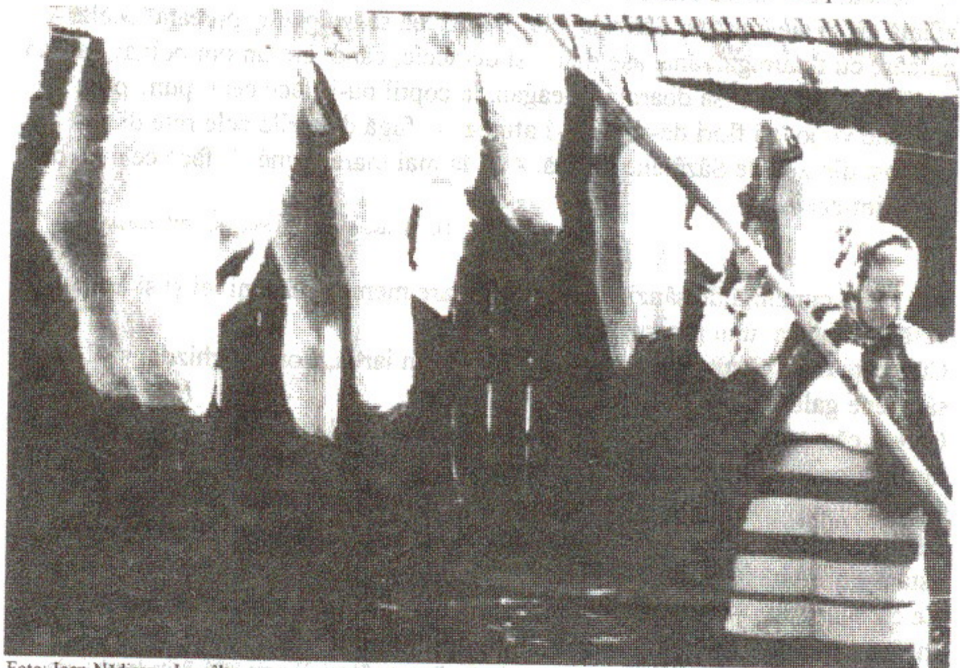
La vâltoare

În zua de Sânzâiene duceu flori de sânzâiene la beserică. Ş-apoi mama bătrână meré la holda de mălai și puné câte-o crenguță la siru de mălai - că pe la