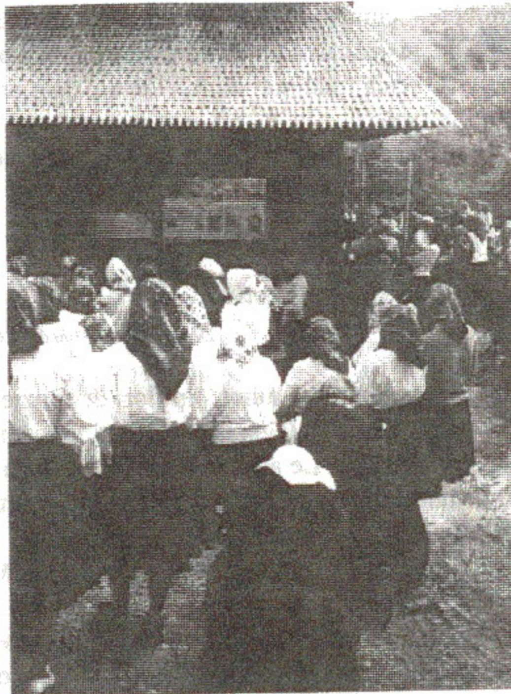
De Rusalii, Budești, 2001

- D-apoi c-amu tătă lumea-i chemată pe zua de Rusalii, api amu, noa... C-o fo' tare frumoasă fată, vestită! Ei n-o știut atunci; până pe marți după nuntă; apoi le-o spus, că s-o temut de mă-sa, de moașa, de bătrână, că trăie ie, că să nu moară bătrâna. Ş-apoi o spus că-i bolnav, că-i în spital, că-i nu știu ce ş-apoi le-o spus pe sară c-apoi o murit. La nuntă n-o știut. N-o știut. Nu le-o spus nime. Frate-său