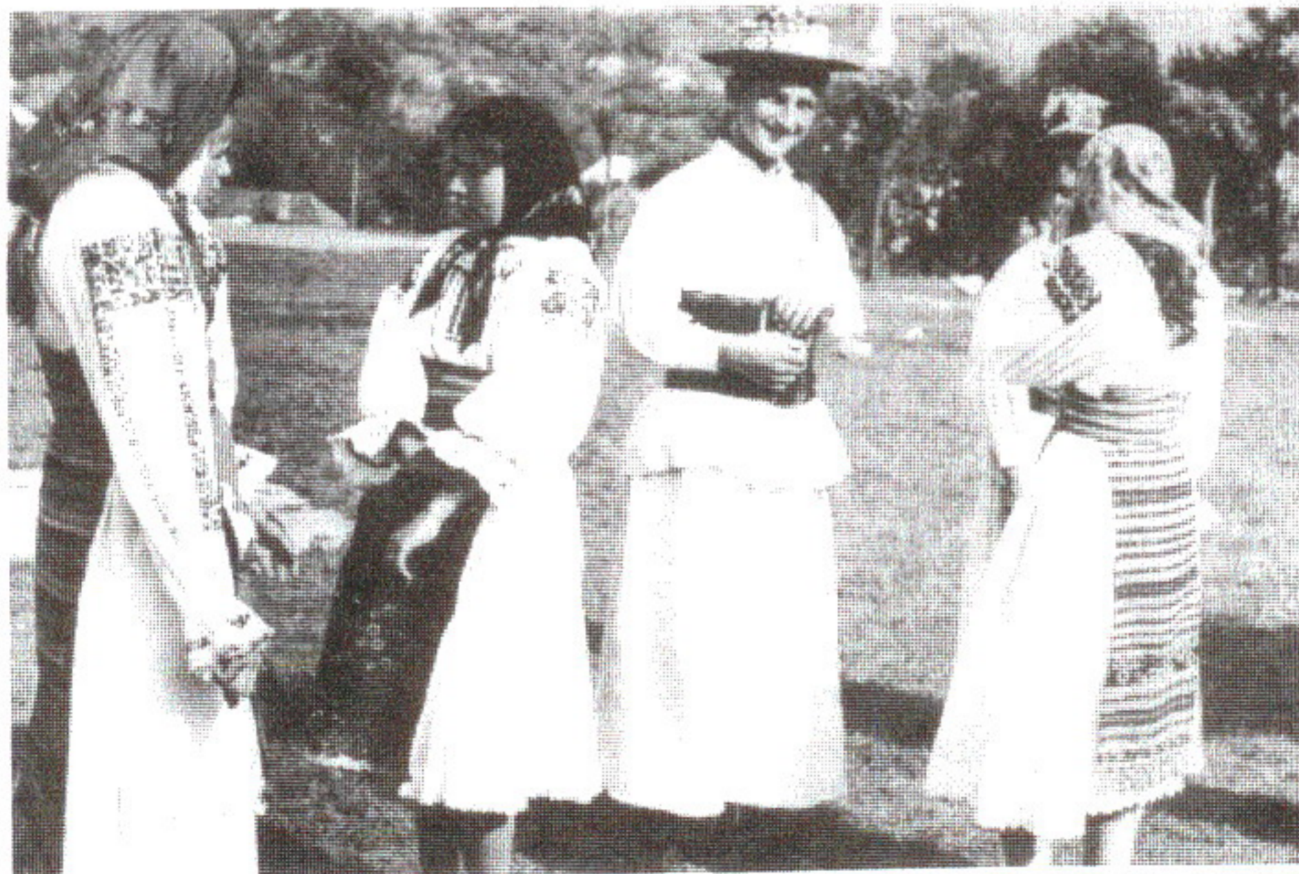
Ioan Nădișan: Fete și feciori din Suciul de Sus, 2001

Tineretul sărbătorește ziua de Rusalii cu mare alai și veselie. Sunt invitați tineri din alte sate – lăturenii – și împreună leagă prietenii, dansează și petrec în bună înțelegere. Îmbrăcați în frumoase costume de