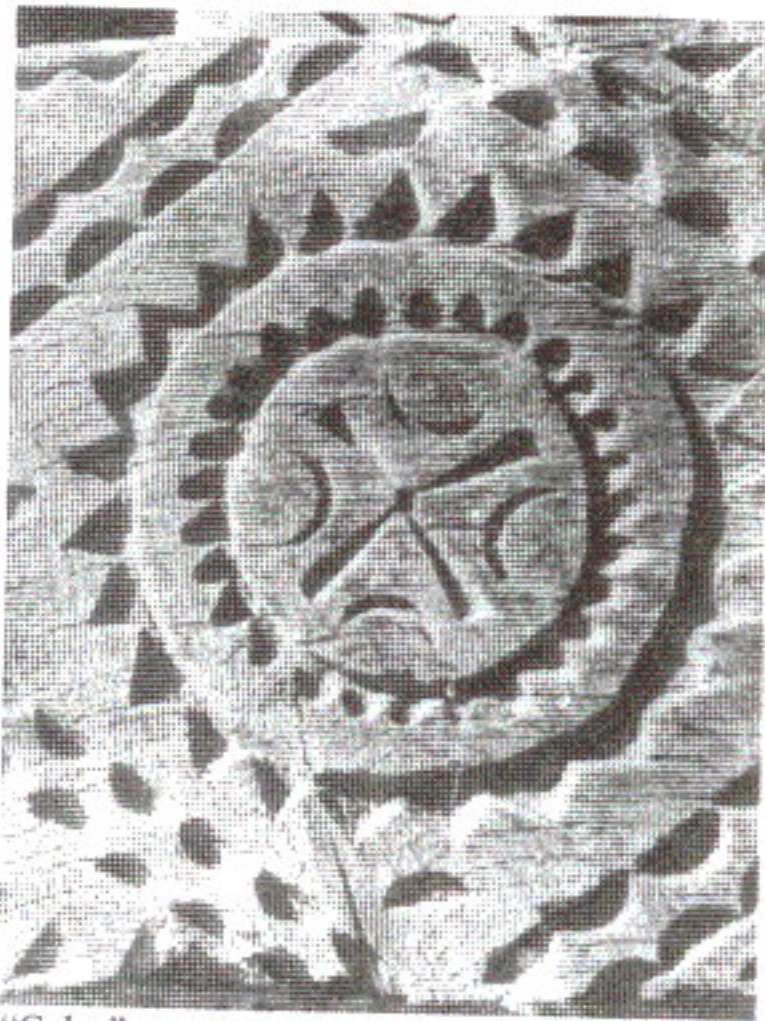
"Colac", pe poartă maramureșeană

Te cunoști, lele, pe poale Că ești o femeie moale, De-ai fi o femeie iute Poalele ți-ar fi lăute Batăr până la jerunte.