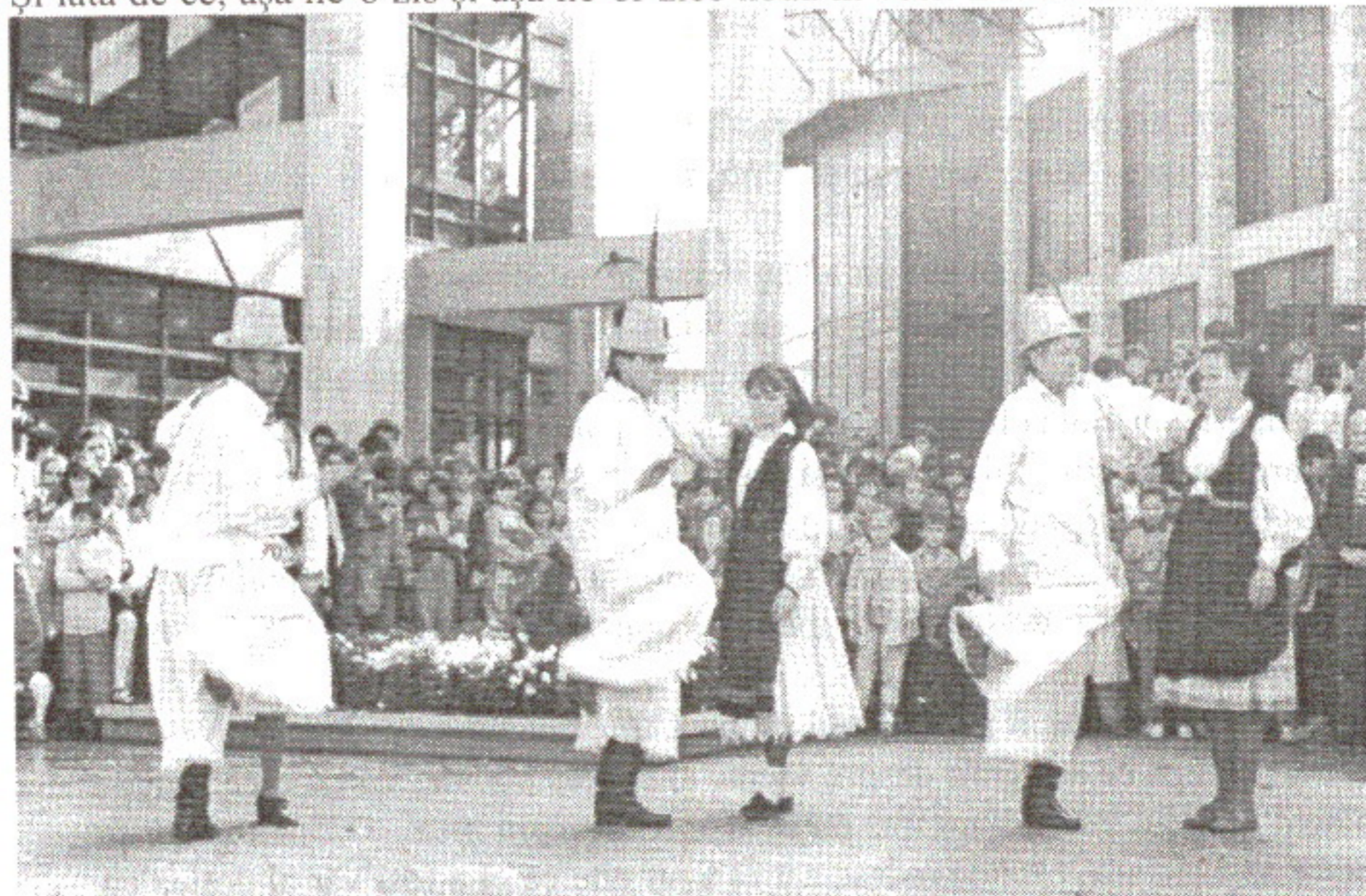
Ioan Nădișan: Dansatorii din Băița de sub Codru, 1982.