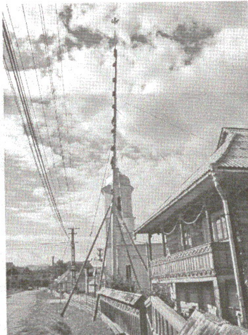
Felician Săteanu: Armindenul din Cupșeni, 2005.

Poartă cum poartă mai multe - Până dinjos de genunche.