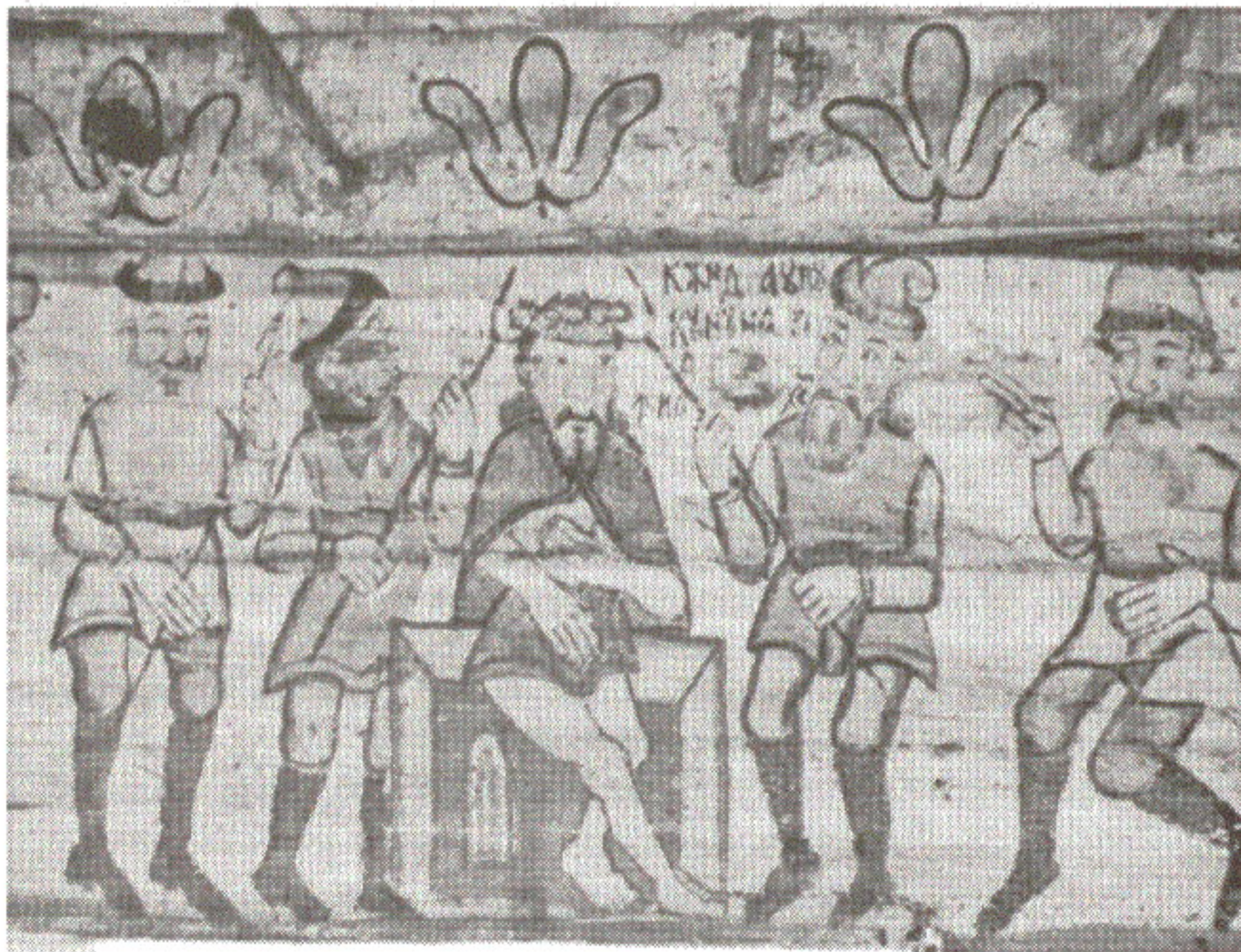
Felician Săteanu: "Când i-au pus cununa de spini lui Iisus", pictură din biserica mică din Cupșeni, sec. XVIII. 2003.

Rămânem în Apșa de mijloc așteptând milă dela Tine O. O. Staline!!