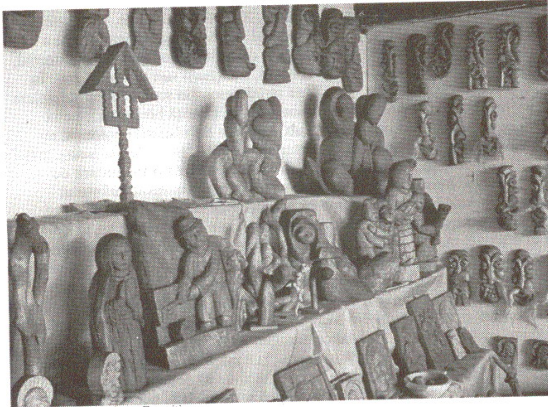
Mesterul Nicolae Șerban - Expoziție.