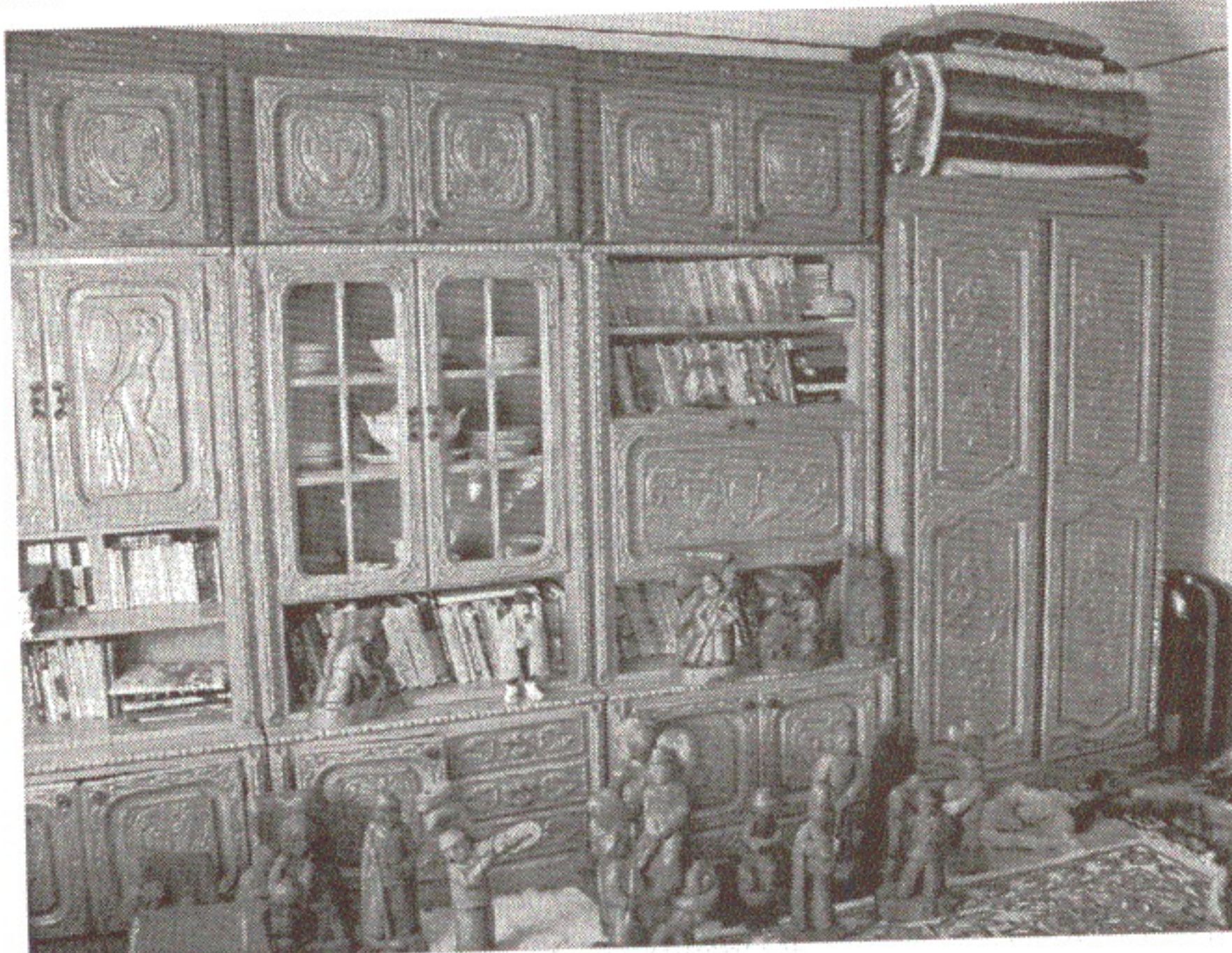
Meșterul Nicolae Șerban - Bibliotecă.