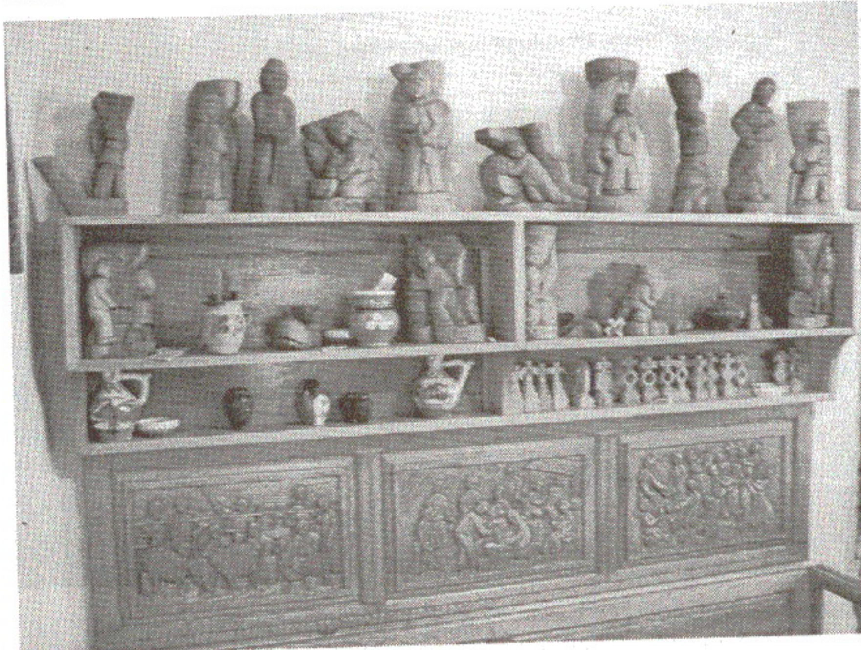
Meșterul Nicolae Șerban - Vitrină.