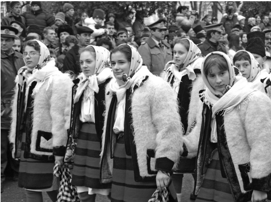
Felician Săteanu: Colindatori din Budești la Festivalul Datinilor de Iarnă, Sibiu, 2004.

Pentru definirea conceptului de obicei, specialiștii s-au raportat aproape întotdeauna la cel de datină; același Ernest Bernea constata obiceiul este un fapt îndelung repetat, exprimat în forme moștenite de la bătrâni. Dar, în timp ce obiceiul este un act social care dă viață și actualizează datinile, datina este o formă socială, un chip al ființei colective prezent continuu în această ființă deținătoare a unor funcții și valori sociale .