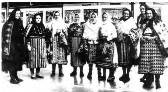
Uzdin, anii '90

Brâul face parte exclusiv din portul femeiesc. Este țesut și lățimea se estimează la 15 cm. Tehnica