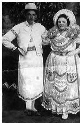
Vladimirovaț, anii '50