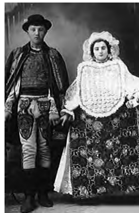
Vladimirovaț, anii '50

Ornamentele în broderia ciupagului nu se pot omite. Broderia era executată pe fir, în sistemul "crucițelor", deși a fost întrebuințată și altă metodă de brodare, pe sistemul de druc . Aceasta, ultima, este cunoscută sub denumirea de "metoda sârbească" sau "metoda nemțească". Metodele au fost împrumutate, dar nu și influența acestor popoare asupra portului. El și-a menținut originalitatea. Ornamentele de pe ciupag aveau mai târziu să cunoască și alte metode cum sunt olama (mătase albă lucitoare) și șlinguitul . Ele apar în perioada interbelică și s-au păstrat și după război. Aceste ultime metode de broderie sunt foarte costisitoare, dar oricum au rămas aplicabile pe o lungă durată sau mai bine-zis, până la dispariția portului. Unele exemplare se păstrează și în zilele noastre. Sunt dovada unei munci migăloase și a unei dârzenii în domeniul artei populare întruchipate în mâinile harnice ale acestor femei.