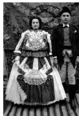
Seleuș, anii '50