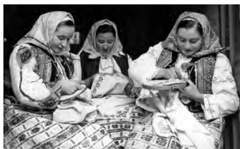
La împistrit, Alibunar, 1960