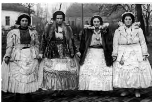
Alibunar, la hora de duminică, 1952

Portul popular femeiesc din satele din Banatul sârbesc este unul de sărbătoare, al sărbătorii. Urbanizarea satului a contribuit și la dispariția portului popular femeiesc. Valoarea acestui port impune obligație morală generațiilor actuale și generațiilor care vin să păstreze aceste valori care fără îndoială scriu cu nume de aur satul în patrimoniul porturilor nu din zonă, ci chiar și din Balcani. Coloritul, cromatica și ornamentele acestui port au fost admirate peste hotarele țării, unde aceste valori au fost văzute.