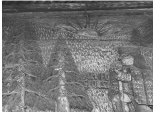
Foto 5: Delia Răchișan, Detaliu pe Poartă tradițională, Brazii , Budești, Țara Maramureșului, 2014