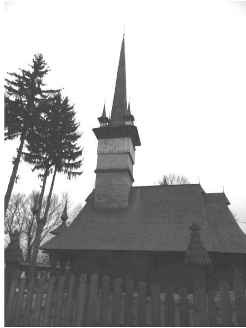
Foto 14: Delia Răchișan, Perechea de brazi din fața Bisericii de lemn „Zămislirea Sfintei Ana” , Coruia, Țara Chioarului, 2014.