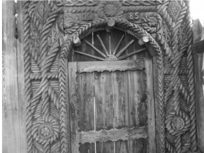
Foto 3: Delia Răchișan, Pomul Vieții , Budești, Țara Maramureșului, 2014.