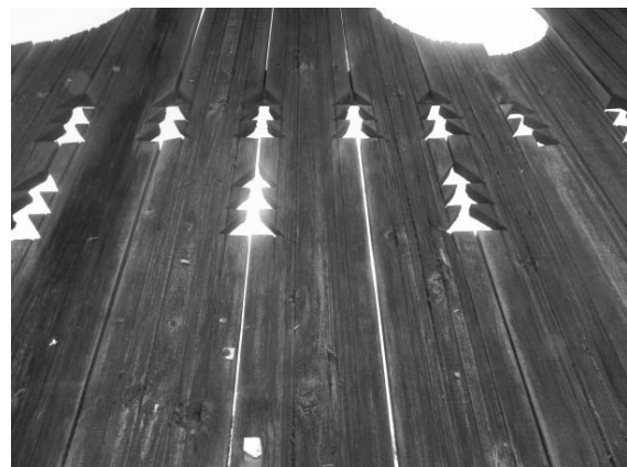
Foto 7: Delia Răchișan, Brazi (traforare) pe Poartă tradițională, Țara Maramureșului, 2014.