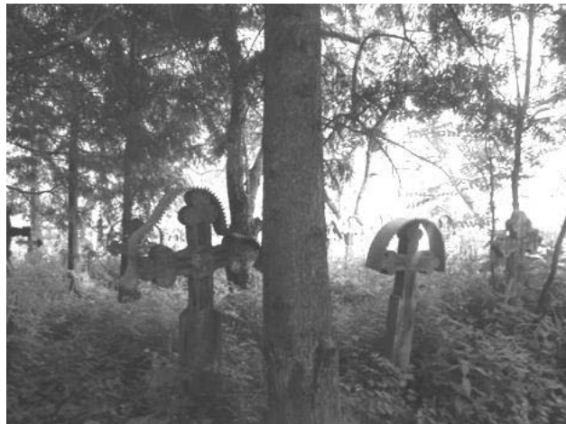
Foto 13: Delia Răchișan, Brazi, Cimitirul vechi , Breb, Țara Maramureșului, 2014.