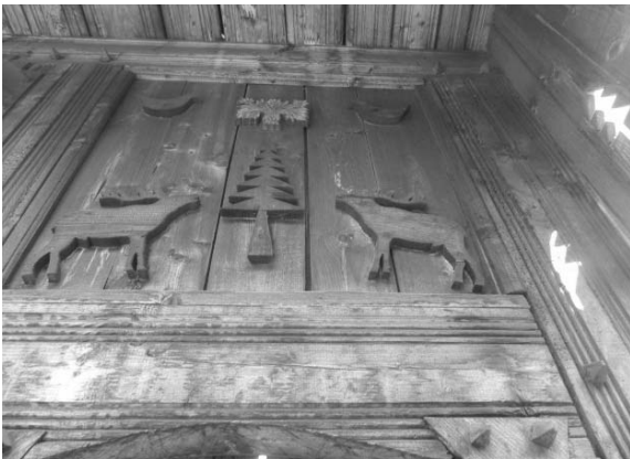
Foto 6: Delia Răchișan, Detaliu pe Poartă tradițională, Brad, cerbi, păsări , Sârbi, Țara Maramureșului, 2014.