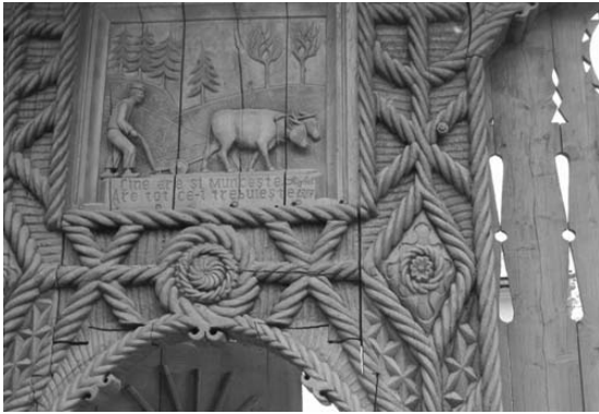
Foto 10: Delia Răchișan, Detaliu pe Poartă tradițională, Brazi, țaran arând cu plugul tras de boi, Hoteni, Țara Maramureșului, 2014.