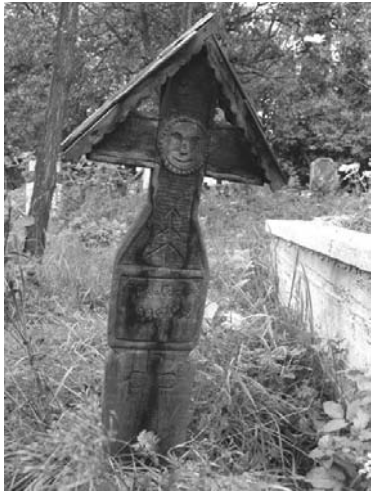
Foto 12: Delia Răchișan, Brad pe cruce de lemn , Rogoz, Țara Lăpușului, 2014.