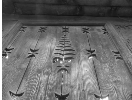
Foto 9: Delia Răchișan, Detaliu pe Poartă tradițională, Brazi, Sârbi, Țara Maramureșului, 2014.