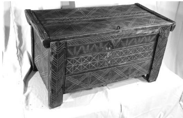
Foto 11: Ladă de zestre, Pomul Vieții , tipar traco-dacic (bradul), Țara Maramureșului, Muzeul de Etnografie și Artă Populară din Baia Mare, 2014.