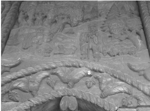
Foto 4: Delia Răchișan, Detaliu pe Poartă tradițională, Brazii, ciobanul, oile , Budești, Țara Maramureșului, 2014