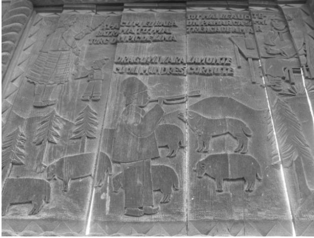
Foto 8: Delia Răchișan, Detaliu pe Poartă tradițională, Brazi, păstor, oi, Sârbi, Țara Maramureșului, 2014.