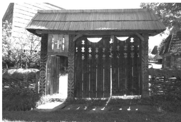
Foto 2: Delia Răchișan, Pomul Vieții pe Poartă tradițională , Giulești, Țara Maramureșului, 2014.