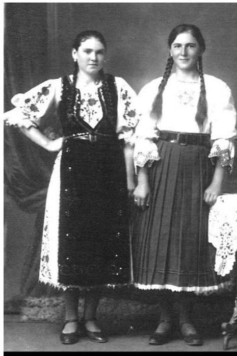
Fete din Chioar, 1925

C-aiesta nu-i târg de boi, Ce iei să dai înapoi, Nici fi măr putregăios Să-l muști și să-l arunci jos.