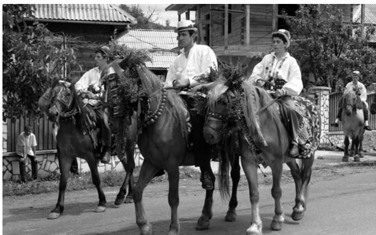
Festivalul nunților, 2006

După ce a jucat steagul, alaiul pleacă la casa miresei să vadă cununa. Cununa e făcută din struțuri roșii cu oglinzi. Fetele dau ajutor femeii care pregătește cununa. Astăzi cununa se face cu struțuri albe fără