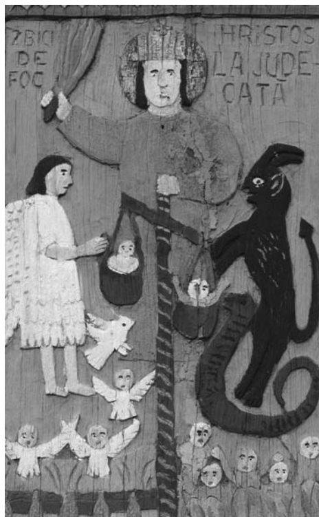
Cimitirul vesel, Săpânța

Universul. „Omul societăților tradiționale nu putea trăi decât într-un spațiu deschis către înalt, unde