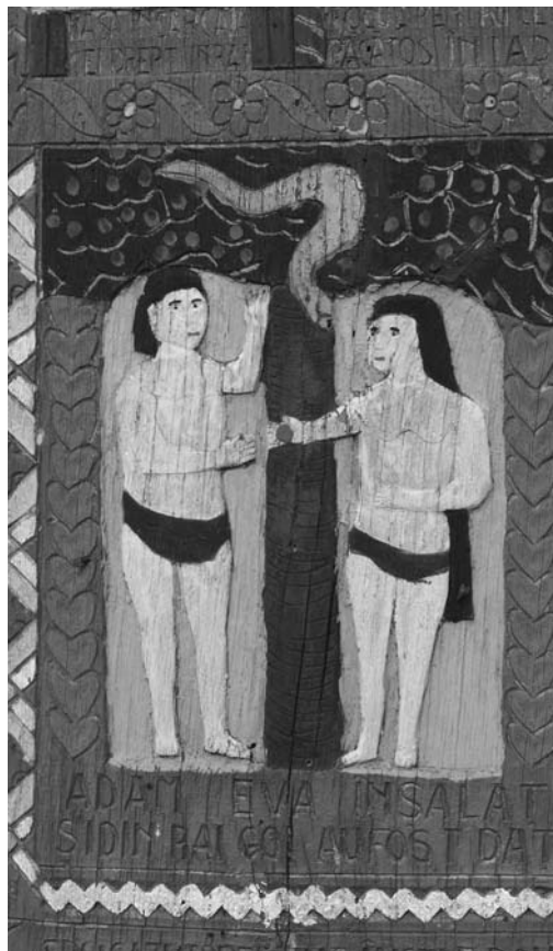
Cimitirul vesel, Săpânța

Îmbrăcămintea devine pentru actant o mască , o barieră care-l apără de cotidian, făcând posibilă trecerea la un alt nivel. Funcționalitatea este evidentă – schimbarea statutului, evoluția, dezvoltarea -, ea se realizează la rîndu-i prin două funcții pe care gestul respectiv le implică: inițierea și apărarea, ambele conținute de calificativele îmbrăcămintei în toate cele trei cazuri, alb și nou, dar și „cusut în casă“, „cumpărat pe munca sa“. Cei trei actanți îmbrăcați în alb devin imagini arhetip ale purității, fapt care le dă dreptul la un nou început. Dar, în primul rînd, albul este cel care le oferă protecția, făcând posibil sfârșitul la nivelul unei stări anterioare, inferioare, și începutul într-o stare nouă, superioară. Purificarea ne apare ca efect al participării conștiente la o limită. Un alt element ce poate fi adus în discuție, în acest context, este cel al contactului actantului cu apa. Nu vom vorbi acum despre simbolismul apei, ci despre cel al gesturilor implicate de contactul cu apa. Scalda rituală, repetată, a copilului, imersiunea din timpul botezului, „ spălatul “ ritualic al miresei și al nevestei, stropirea de către mireasă a alaiului în repetate rînduri,