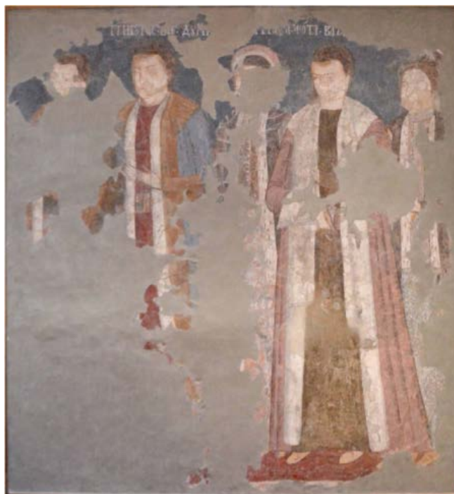
Fig. 1. Fresca extrasă din Biserica din Crețești aflată astăzi la Muzeul de Artă din Craiova