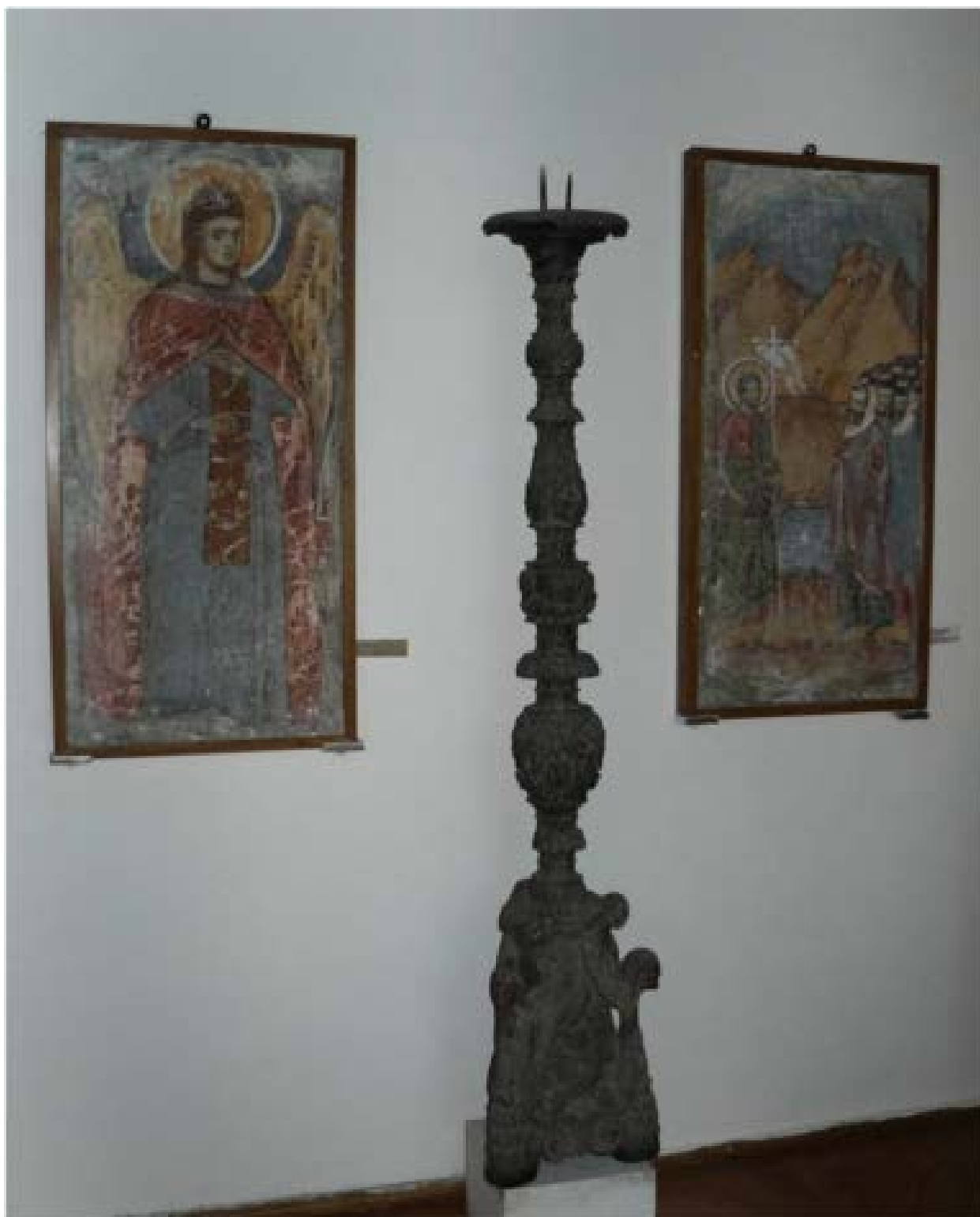
Fig. 4. Fresca extrasă din Biserica din Crețești aflată astăzi la Muzeul de Artă din Craiova