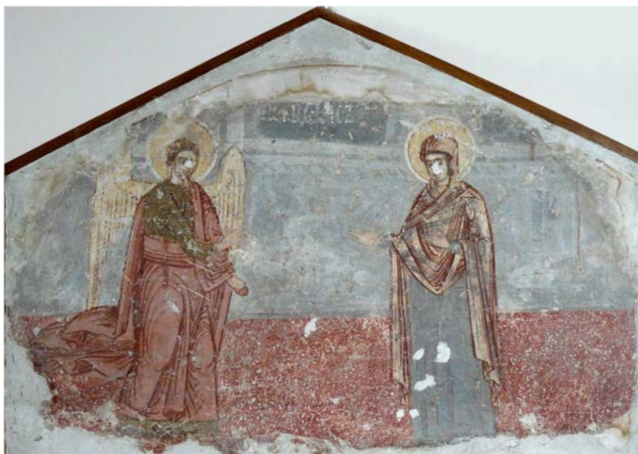
Fig. 2. Fresca extrasă din Biserica din Crețești aflată astăzi la Muzeul de Artă din Craiova