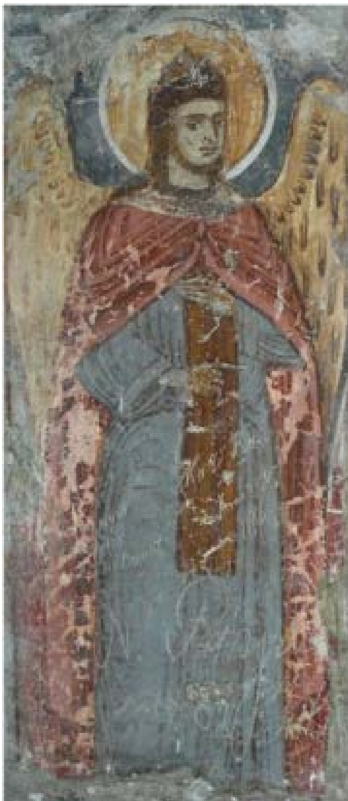
Fig. 3. Fresca extrasă din Biserica din Crețești aflată astăzi la Muzeul de Artă din Craiova