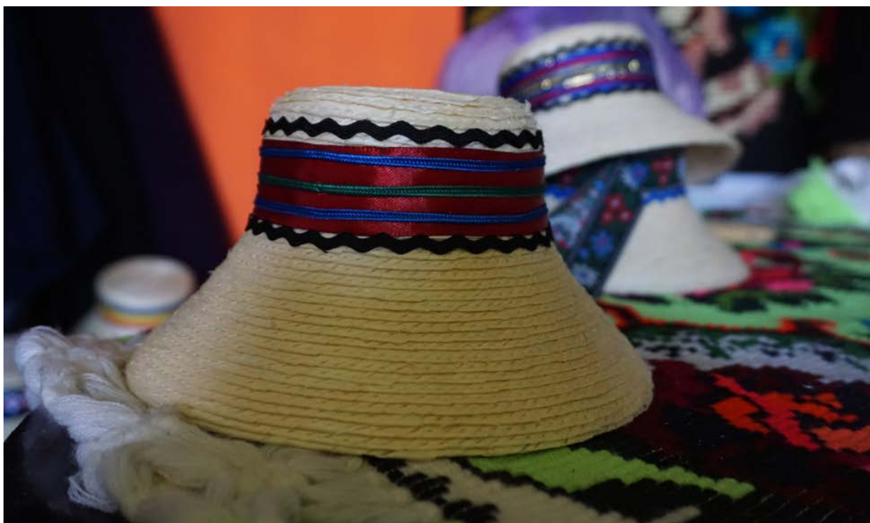
Clop din Maramureșul Istoric

După ce e gata cusut, înfoc presa. Când îi înfocată, bag clopu la presat și arată mult mai bine. La urmă se pune cipca sau panglica. Mai demult se puneia șânor . Meseria nu-i gré, numa trebe să ai plăcere și bunăvoință. E o meserie curată.” 3