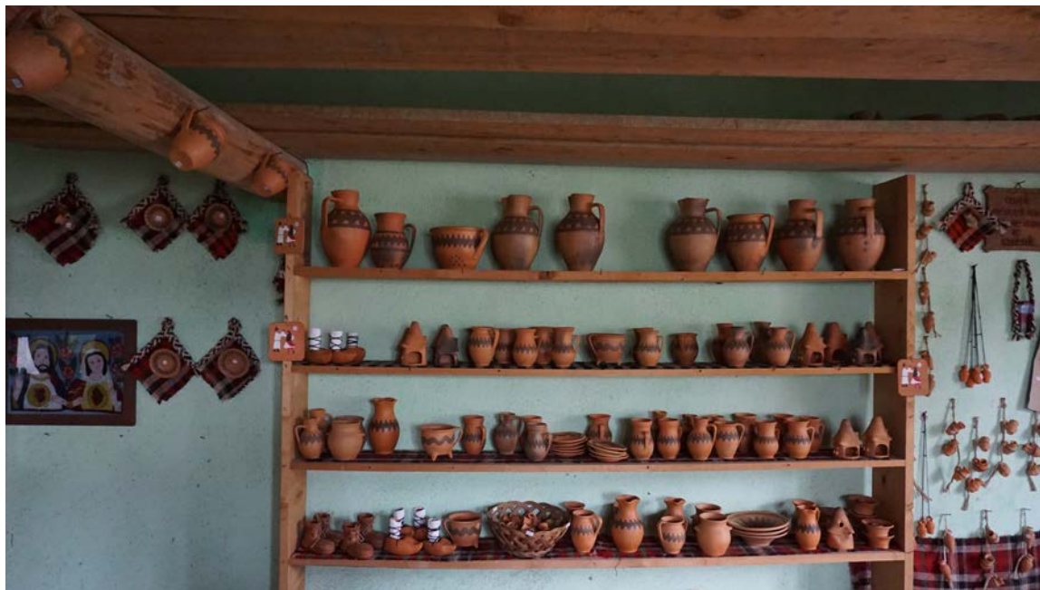
Produse ceramice de Săcel

Obiectele pe care le avem în atelier au rămas din tată în fiu, din generație în generație. Fiecare obiect are 3-4 întrebuințări, pentru că bunicii și străbunicii noștri nu dispuneau de spațiu și de o veselă așa mare ca să poată avea o gamă largă de obiecte. Cele mai utilizate sunt bocăile pentru lapte. În ele se pune lapte la prins . Mărimea diferă de la 1 l, la 2-3 l, după preferință. Se